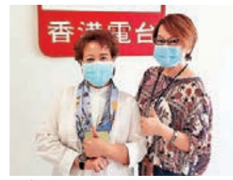
廚神三姐與淑梅姐。

也大了。」提起婚姻，每次提及三姐夫三姐都欲言又止，談到美儀依然是單身女神，三姐有這樣的回應，「當然有一個完整家庭是很多人夢寐以求的，但時也命也，緣分強求不來，儘管某一方做到多好或者已盡力維繫，單方面都不能成事……美儀可能是男子性格，為保護自己擺出一副剛強面孔，早期拍檔，她都擺了一副強勢的姿態，磨合幾集之後，她對我非常尊重，改口稱呼我做阿姐，相處時間長了，我發覺她內心有溫柔善良的一面，可惜暫時還沒有人發覺得到！我祝福她早日找到一位愛她又珍惜她內在美的人，一位入得廚房出得廳堂的好女婿，不知哪位男士會有這份福氣，我祝福她！」 其實愛人如己的三姐經歷並不平坦，自小被父親點名栽培，13歲輟學跟隨到市場挑選新鮮食材，站在父親開設的石碼場飯堂負責沖奶茶、煮公仔麵，「八兄弟姊妹四男四女，我排第三以前叫三妹，現在變了三姐。爸爸常說我當妳兒子一樣的養，妳要畀心機，不聽話妳沒法子生存，有一天我死了，妳不用送我上山，我的棺材會自己滾上去……這句說話一直烙在我心裏！我以前交過紅色成績表給爸爸，今天我終於合格了，我想向父親說，你安樂了，現在我可以名正言順扶爸上山了！」 其實三姐大謙虛，她獲獎無數，成績表何止合格，實在非常高分，更超越了小學老師對她的評語：溫文爾雅、學業漸進！三姐就是不斷自強的女廚神，也將她本人的名言：「天無絕（勤）之路」發揮得淋漓盡致。希望香港飲食業界繼續致力做好，待疫情過後，正如三姐所言市面迎來V形反彈，大家生意興隆！