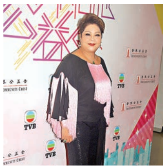
肥媽是唱得又煮得的藝人。

什麼東西，甚至是廚餘，她也能化腐朽為神奇。 視家人如命根的肥媽，不單照顧親生的子女，連繼子繼女也視如己出，她共有6名子女、13個孫，為緊密維繫一家人感情，每逢周末所有子女及配偶都帶同孩子共20人，會到她家聚會及吃飯，她盡量不在周末工作及應酬，又要親自下廚煮愛心住家飯給全家人吃。 肥媽以家庭為重，會逐步減少登台及各方面工作，但澄清並非封咪，仍會參與慈善、小型演出等活動，可說是半退休，皆因她想多花時間陪伴丈夫。但她鄭重聲明不會放棄烹飪節目，因她熱愛煮飯。 前幾年她和Rick才舉行過結婚周年紀念派對，我也有去恭賀他們，他倆恩愛非常，祝Rick早日康復！