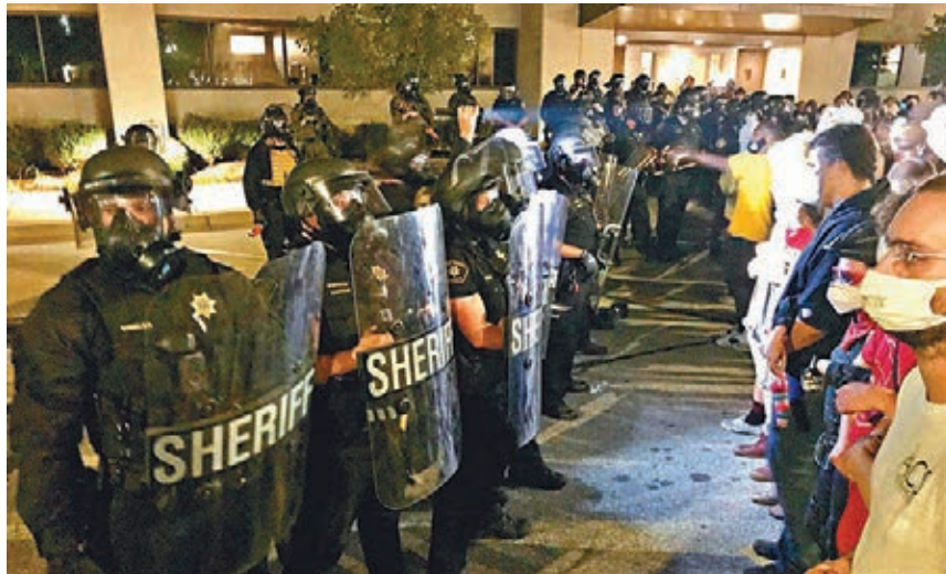
▲示威者與警員在警局外對峙。