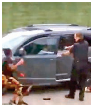
▲警員從後扯着布萊克的衣服，向他連開7槍。