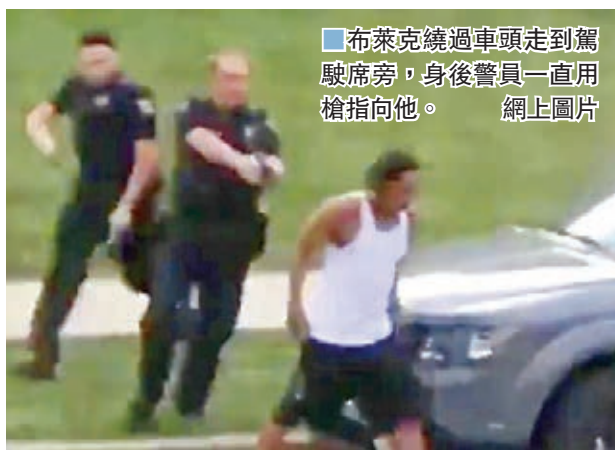
■布萊克繞過車頭走到駕駛席旁，身後警員一直用槍指向他。