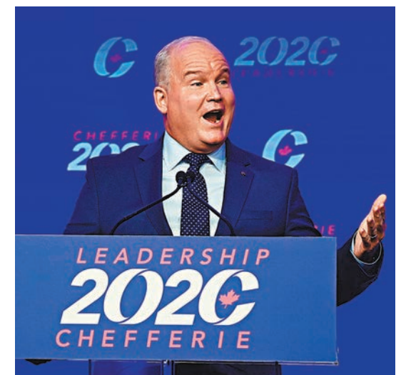
■奧圖爾曾在加拿大空軍服役。