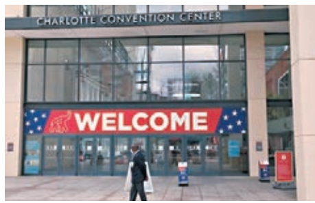
疫情下共和黨大會仍邀請觀眾出席。