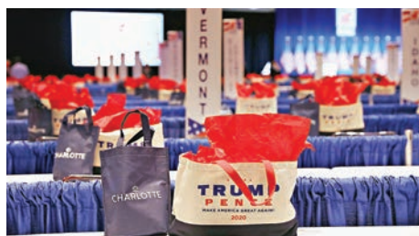
黨代表座位擺放紀念品。

拜登拒絕承認「或尋求連任」 美國總統特朗普多次嘲諷民主黨總統候選人拜登年事已高，無法勝任總統。拜登前晚接受美國廣播公司(ABC)訪問時回應稱，自己狀態良好，若能在大選中勝出，他會考慮在4年後競逐連任。 美國目前離任時最年長的總統是時年77歲的里根，現年78歲的拜登和74歲的特朗普無論誰人當選，都很大機會打破這個紀錄。拜登認為外界對70歲以上候選人有所擔憂很正常，不過他已經做好準備。他還反駁特朗普大肆攻擊他的精神狀態，「看着我，總統先生，來吧，看看我們的狀態如何。」 特朗普因抗擊新冠疫情不力飽受抨擊，拜登也直指特朗普未有承擔總統應盡的責任，「我並不會因為眼前的危機指責他，我要指責的是他對現狀置之不理，沒有提出任何解決方案。」他同時批評部分美國民眾以「自由」為名，拒絕戴口罩遏制疫情擴散，保護自己和他人的健康。拜登表明自己如果當選，將會遵循科學方法並聽從專家指引，強調控制疫情是讓經濟民生重回正軌的唯一途徑。 法新社/彭博通訊社