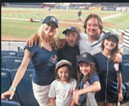
▲康韋與喬治育有4名兒女。圖為一家人在數年前的合照。