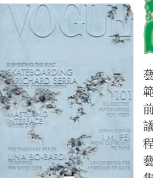
富藝斯寫下的 Daniel Arsham 紀錄保持至今