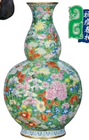
嘉德的乾隆 御製洋彩萬花獻瑞大葫蘆瓶，580萬元成交。

紐約亞洲藝術周9月中開鑼 美國到目前仍是新冠肺炎最嚴重地區之一，但「紐約亞洲藝術周」則無懼疫情肆虐，依然定於下個月份的中下旬舉行。佳士得紐約將於藝術周的11場現場及網上拍賣，推出中國、印度、日本及韓國等藝術精品。有興趣者自9月16日起可前往洛克菲勒中心藝廊欣賞預展，以及在其後的拍賣，盡情搜購別具魅力的亞洲藝術品。紐約佳士得是次的重頭戲是「崇聖御寶—詹姆斯及瑪麗蓮·阿爾斯多夫珍藏」專場。阿爾斯多夫伉儷是芝加哥企業家、收藏家、慈善家，被認為是美國藝術鑑藏史上里程碑式的人物，這次由紐約佳士得釋出的重要藏品，集中在9月24日的兩個私人專場，有約250件，還有另外的藏品則將通過一個Online專場推出。阿爾斯多夫伉儷珍藏，瓷器部分極為精彩，尤其是清代單色釉瓷器，數量多品質高，蔚為壯觀。9月25日，紐約佳士得「重要中國瓷器及工藝精品」專場，將有35件明清頂級官窯瓷器珍品。其最精彩的一部分來自美國德克薩斯州企業家布華朗的收藏，僅永樂青花大器就有四件之多，其中一件永樂青花大盤為北印度莫臥兒王朝第五位皇帝沙賈汗舊藏，器壁有銘文，底部鑽有三小孔狀標記，據學者分析，此乃君王敕令鑄刻，以示身份或傳承。本場另有雍正/乾隆時期御窯珍品粉彩羅漢坐像及難得一見的乾隆黃地青花梅瓶等，均為罕珍物件。9月25日，紐約佳士得的同一專場還將推出為數不少的高古瓷、古玉、青銅器等。高古瓷最大亮點是一組唐三彩，其中一件體量碩大的唐三彩駱駝曾經兩度經過英國著名古董商艾斯肯納齊之手。青銅器也達30件，領銜器物是一件絕美的春秋龍紋大蓋鼎，為比利時著名古董商吉賽爾舊藏。另一大行紐約蘇富比將於本屆藝術周，呈獻各類亞洲藝術精品，從高古藝珍至當代佳品均包羅其中。具體場次、拍賣日程安排如下：9月22日上午有「雅靜清靈—康熙御製私人珍藏」、「瓊骨：玉」、喜馬拉雅及東南亞藝術」專場；另外，9月23日上午有「中國藝術珍品」專場。還有「博古：亞洲藝術」網上拍賣，持續十餘天，於9月18日至29日舉行。「雅靜清靈」專場拍品，是藏家自世紀70年代收藏而成，來源顯赫。多曾屬仇焱之、奈特、趙從衍等的舊藏，焦點包括一件袖裏紅綠彩折枝玫瑰紋水盂、冬青釉暗花海水龍紋茶葉尊以及一組豇豆紅釉文房瓷器等。「瓊骨：玉」專場同樣備受矚目，本場拍賣將呈獻史蒂芬·瓊骨三世收藏逾60件玉器珍品，從中可見自新石器時代至清代各階段中國玉雕發展。焦點拍品包括一件明代青玉雕童子牧牛雕件、清乾隆黃玉雕瑞獸擺件以及清道光白玉雕螭龍鈕「慎德堂寶」方璽等。「印度、喜馬拉雅及東南亞藝術」專場，其中的尼泊爾9/10世紀銅鑲金觀世音菩薩坐像、西藏17世紀第七世噶瑪巴確札嘉措坐像唐卡，以及印度抽象藝術家斯林·莫哈迪迪的早期畫作精品等，都是存世不可多得的藝術珍品。「中國藝術珍品」專場，本場拍賣呈獻逾300件中國藝術珍品，涵蓋商代至民國各時期。焦點包括戰國青銅錯金銀嵌琉璃乳釘紋方壺、清乾隆青釉裏紅綠彩折枝蓮紋寶瓶、一組早期銅鑲金佛教造像以及威廉湯普森·博伊斯收藏的玉雕等。紐約蘇富比「博古：亞洲藝術」網上拍賣，推出逾150件各式亞洲藝術珍品，焦點包括唐代銅鑲金菩薩坐像、一組清代料器，以及源於洛克菲勒家族舊藏之墨地彩瓷等。另有書畫作品，作者包括丁衍誦、何懷碩等名家。