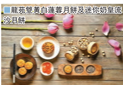
龍苑雙黃白蓮蓉月餅及迷你奶皇流沙月餅