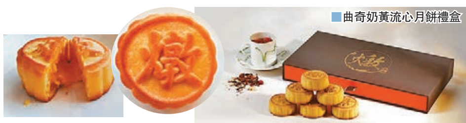
曲奇奶黃流心月餅禮盒

今年疫情下，不少明星都直播烹煮，當然坊間亦有不少由明星開設的餐廳，都加入自家品牌月餅行列以慶祝中秋。例如，燉特別推出「曲奇奶黃流心月餅」，曲奇餅效果配流心奶皇餡，再加兩包玫瑰洛神花茶，就是今年中秋節推出的月餅禮盒。如果用氣炸鍋160度，焗6至8分鐘，是曲奇皮最佳食法，配以洛神花茶的酸酸甜甜，奶黃月餅味道極為搭，飲啖茶食餅就不怕食滯啦！現在，由即日起，限量早鳥價HK$208。另外，一向以來，美食博覽都是售賣榴槤月餅的地方，愛好榴槤者都會在這個階段購買，可惜疫情下不知道哪有。今年，馬來西亞品牌duria與香港藝人友人共同創製「杰哥榴蓮」，推出「黑刺貓山王榴槤冰皮月餅」，採用由馬來西亞直送貓山王榴槤製成，在月餅上印有「恩」字，代表感恩，一家團圓，希望大家「吃杰哥榴蓮，交天下朋友。吃貓山王感恩月餅，交天下孝子朋友。」