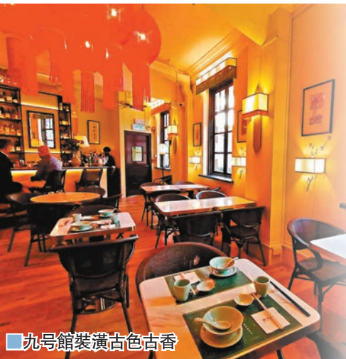
九號館裝潢古色古香

一向以來，中環下亞厘畢道的香港外國記者會的會所餐廳，中午有一定捧場客，不過最近與他們相鄰的藝穗會多了間九號館進駐，在這區吃午餐不再只得協會的會所餐廳這個選擇。這間混合中西飲食的餐廳九號館，外形是一間英式建築物，行上樓梯再經一條展覽畫廊才步入餐廳，餐廳不算大，內裏裝潢充滿中國味，紅燈籠高高掛，中式的桌子與椅子、復古茶壺、復古掛牆鏡，但又保留了英式酒吧枱、歐式精緻壁爐，整間餐廳極具香港特色——華洋雜處。而且，餐廳經常有新菜式推出，也吸引不少外國客人光顧。