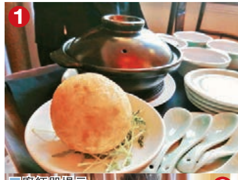
廚師即場示範貴妃湯金球海鮮泡飯