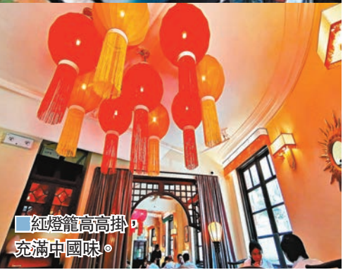
紅燈籠高高掛，充滿中國味。