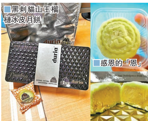
黑刺貓山王榴槤冰皮月餅

友。」預訂: wwtorder@gmail.com 金城假日酒店龍苑中菜廳由即日起至9月29日，特別推出多款巧製的美味月餅，每日新鮮製成的月餅，採用精選蛋黃及頂級香滑蓮蓉，糅合傳統製法及創意包裝而成。例如，傳統的「雙黃白蓮蓉月餅」採用細膩清香的白蓮蓉配上甘香鹹蛋黃，一盒四個，每盒HK$408(早鳥價HK$285)。還有，受歡迎的「迷你奶皇流沙月餅」，一盒八個，每盒HK$348(早鳥價HK$243)，如於9月1日前預訂月餅，可享早鳥價。城景國際樂雅軒於今年中秋節推出流心奶黃月餅禮盒，1盒4個裝，嚴選高品質牛油及秘製奶黃餡烘焙，餅皮酥脆可口，入口即溶，讓人齒頰留香。所有月餅均是百分百香港製造，保證食得安心，送禮自奉均為首選。建議食用前可放入微波爐加熱5至10秒，散發出之奶香及蛋黃香氣襲人，令人食慾大增。若能邊品茗邊品嚐月餅，更能將其味道推到更高層次。現凡於9月25日前購買月餅禮券，可享低至7折優惠，預購達16盒或以上，更享低至5折。由即日起至9月25日，大家可在網上https://bit.ly/3ixVMwm以激筍優惠價55折優先預訂恒香多款月餅包括三黃白蓮蓉月餅、雙黃蓮蓉月餅、流心奶黃月餅、迷你月餅、流心月餅系列、百年經典系列，並於9月18日至9月28日起憑電子券到各分店換領，準備好與家人歡度佳節，味賞中秋。