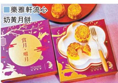
樂雅軒流心奶黃月餅