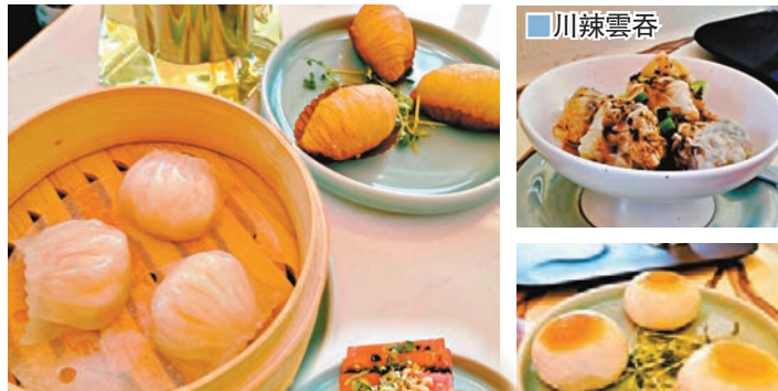
筍尖鮮蝦餃、以正蘿蔔酥