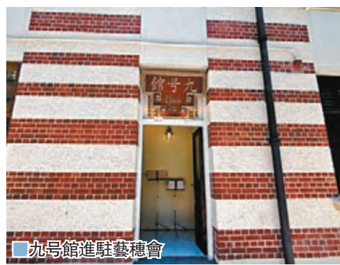
九號館進駐藝穗會