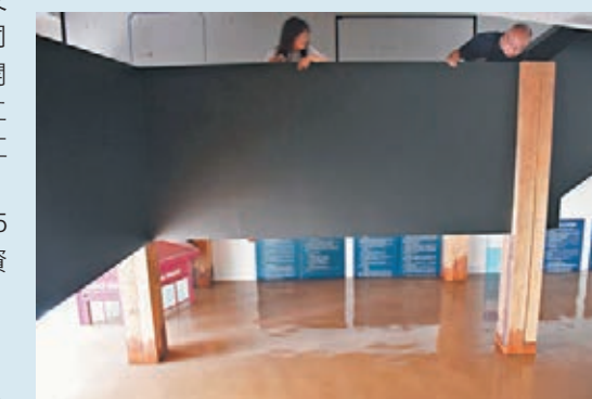
21日洪水湧入時，險將書店一樓沒頂。

此外，據香港文匯報記者了解，由於本次洪水持續時間長，過水量較大，攜帶的污染物較多，沉澱下來的淤泥較多，作業量較大，預計還需要5個工作日才能完成重慶路主幹道及知名景區的清淤工作。 香港文匯報記者 孟冰 重慶報道