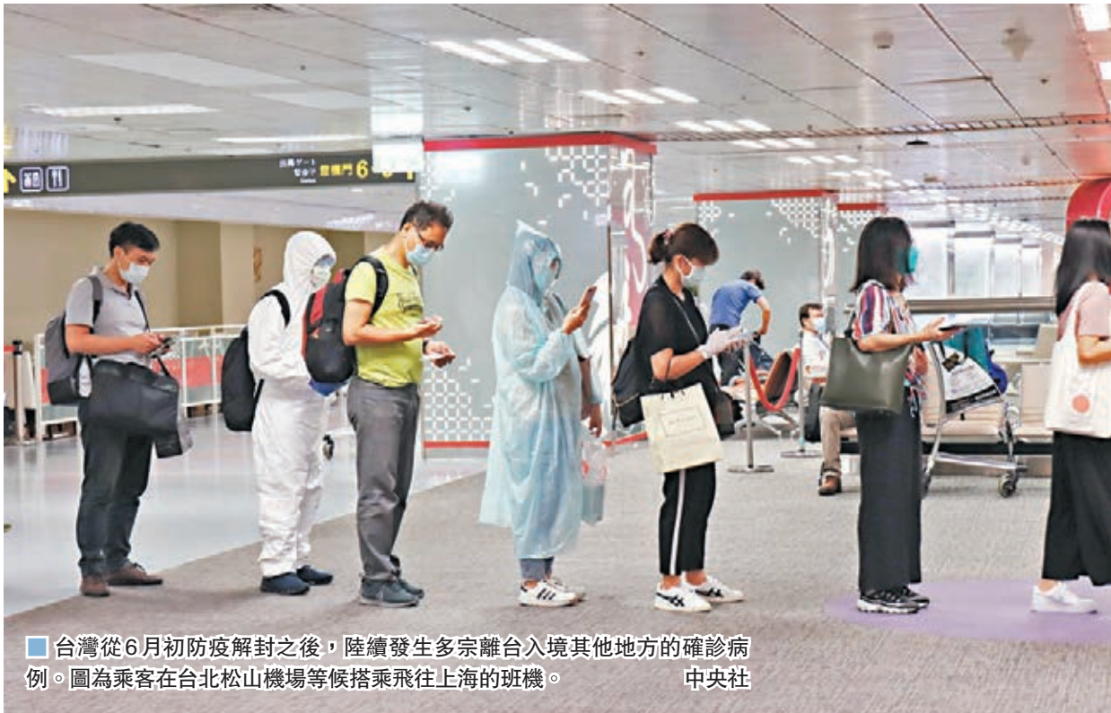
台灣從6月初防疫解封之後，陸續發生多宗離台入境其他地方的確診病例。圖為乘客在台北松山機場等候搭乘飛往上海的班機。

再加上台灣從6月初防疫解封之後，仍陸續發生多宗離台入境其他地方的確診病例，從而引發大眾