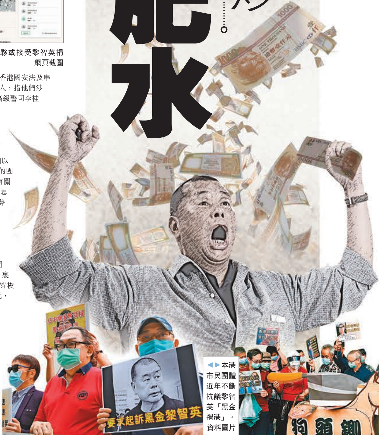
本港市民團體近年不斷抗議黎智英「黑金禍港」。資料圖片