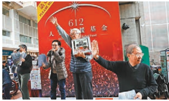
《蘋果日報》向撐黑暴的「612基金」捐錢。資料圖片

在去年的修例風波中，攪炒派藉支援暴亂向市民籌款成立所謂「612人道支援基金」(「612基金」)，並宣稱會資助違法暴徒打官司及緊急經濟支援。「612基金」聲稱截至今年4月30日，已籌得逾1.1億元。不過，由於該基金一再被踢爆亂花捐款、賬目不明，後來已較少人願意捐錢。值得注意的是，頻頻告急、自身難保的《蘋果日報》在去年7月至10月竟向該基金豪捐135萬元，可見黎智英在修例風波支援黑暴分子中亦有角色。