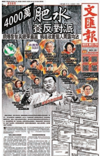
本報曾在2014年報道黎智英黑金資助反對派。

2011年，網上分享軟件 Foxy 流出密件，首度揭露黎智英在2006年至2011年期間向攪炒派多個政黨和個人提供巨額捐款，狂開高達5,000萬的「大水喉」支持攪炒派禍港。該批密件中，除了有黎智英向公民黨和民主黨捐款的單據外，還有一份有關黎智英2011年開支計劃的文件，當中列出民主黨在過去5年接受黎智英逾1,300萬元的政治獻金；同期公民黨則接受黎智英逾1,400萬元捐款。