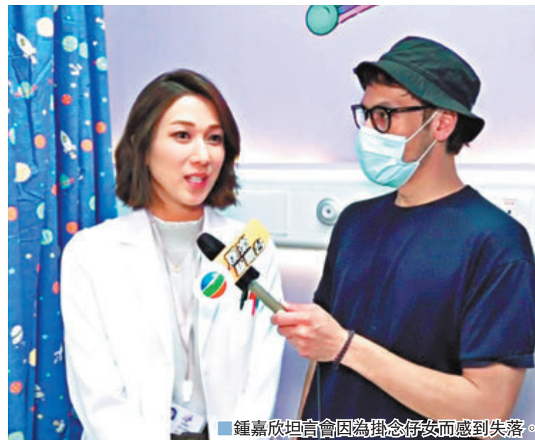
鍾嘉欣坦言會因為掛念子女而感到失落。