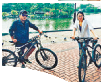
呂方夫婦愛得低調。網上圖片

昨日初為人母的Rainbow在社交平台分享母女二人合照，B女首度曝光，相中Rainbow抱住B女，兩人鼻尖對住鼻尖，十分溫馨；而爸爸呂方則未有出鏡。