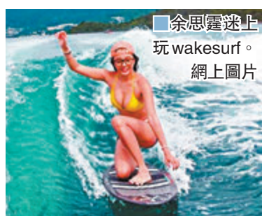
余思靈迷上玩wakesurf。網上圖片

泫雅所屬公司Pination方面昨日表示：「泫雅很長時間內比任何人都積極準備活動。2019年泫雅首次向大眾坦言自己患有憂鬱症及恐慌障礙，被診斷為血管迷走神經性暈厥，為了能在原本於下周進行的回歸活動中展現最佳狀態，她一直堅持治療。但最近又發生了血管迷走神經性暈厥的情況，作為有義務保護藝人的經理人公司，我們現在得出的結論是泫雅需要充分的治療和狀態的穩定，暫時將回歸活動延期至泫雅恢復健康後再進行。本公司將全力支持泫雅身體恢復穩定，以健康的面貌重新開始活動。對於等待回歸的各位粉絲以及其他相關人士，本公司深感抱歉。」