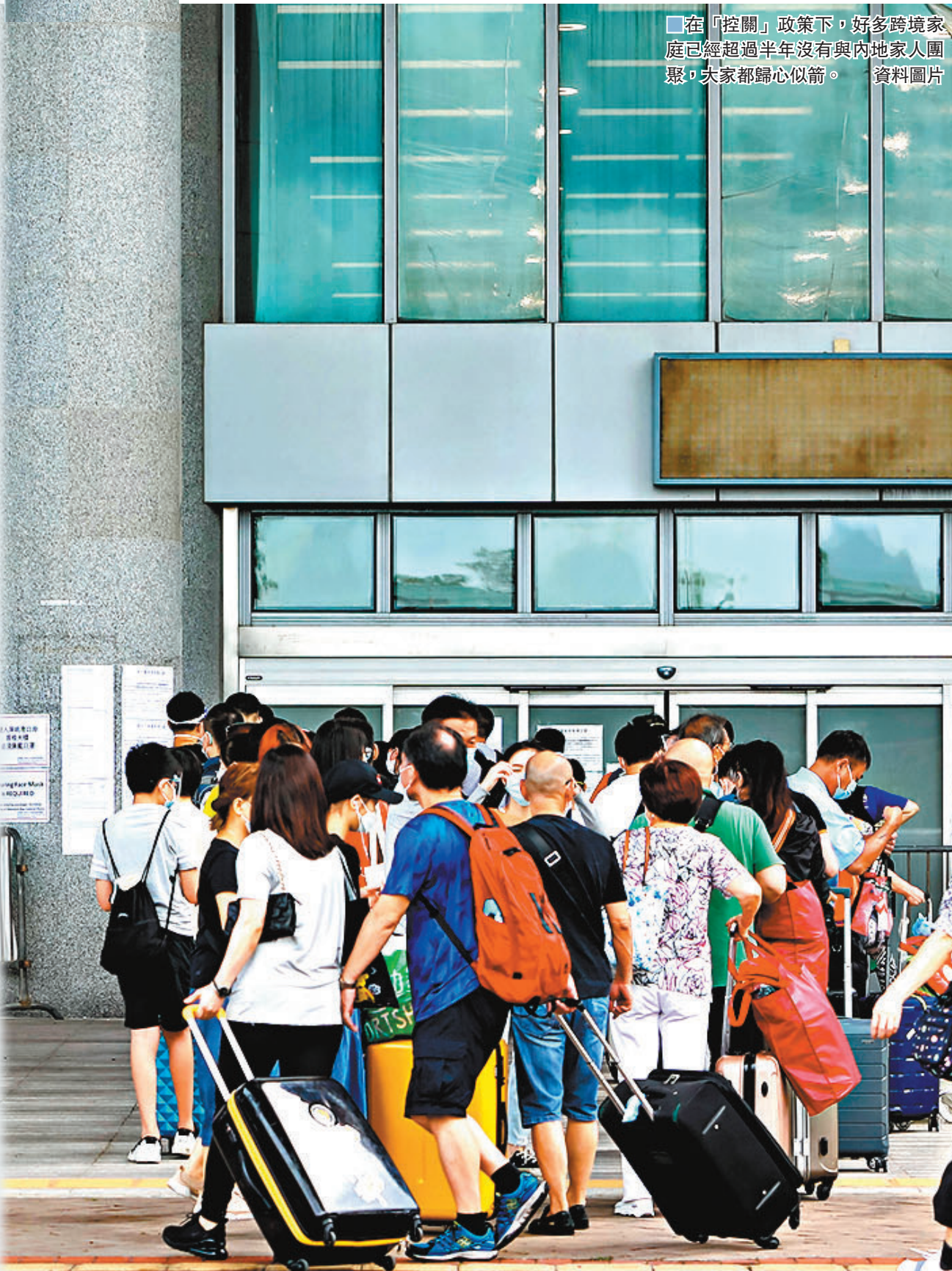
在「控關」政策下,好多跨境家庭已經超過半年沒有與內地家人團聚,大家都歸心似箭。資料圖片