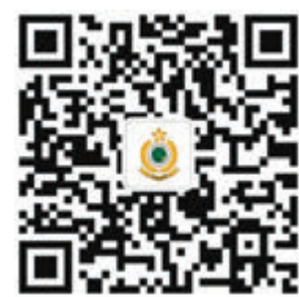
「香港海關跨境車輛清關資訊發布」微信公眾號二維碼。

香港海關會通知道路貨物資料系統的使用者微信公眾號啟用事宜,亦會於各陸路邊境管制站向跨境車輛司機派發宣傳單張。微信公眾號的二維碼已上載香港海關網站:www.customs.gov.hk/tc/home/index.html。