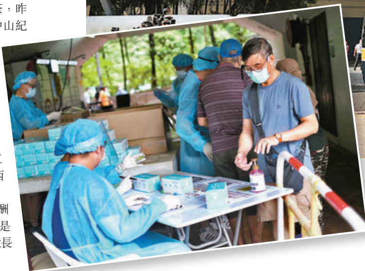
▲一眾傳染病專家也呼籲所有市民參加下月一日舉行的社區普及檢測。圖為民政總署向居民派發檢測咽拭子採樣套裝和一盒口罩。資料圖片