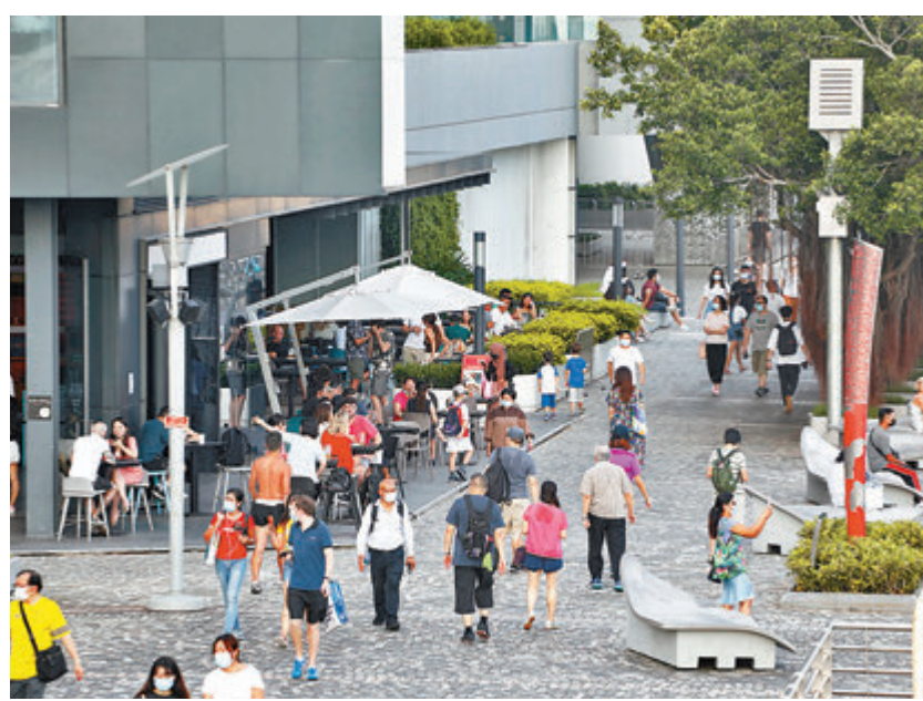
■陳肇始重申，普及檢測有助掌握社區感染情況，及早切斷傳播鏈，參與的人數愈多，對整體疫情控制愈理想，政府會積極宣傳，並保持透明度。

陳肇始昨日接受電台訪問時指出，化驗室只會知道樣本條碼，不會獲得市民個人資料，而樣本在計劃結束後會銷毀。她指出，雖然香港近日的新冠肺炎確診數字有回落趨勢，但仍有不少新個案的感染源頭未明，社區仍有隱形傳播鏈，加上仍有外宿宿舍和貨櫃碼頭兩個群組，政府除了會繼續緊密追蹤控制疫情外，亦需要市民積極參與檢測，呼籲市民為己為人應接受檢測，但現階段難以評估有多少市