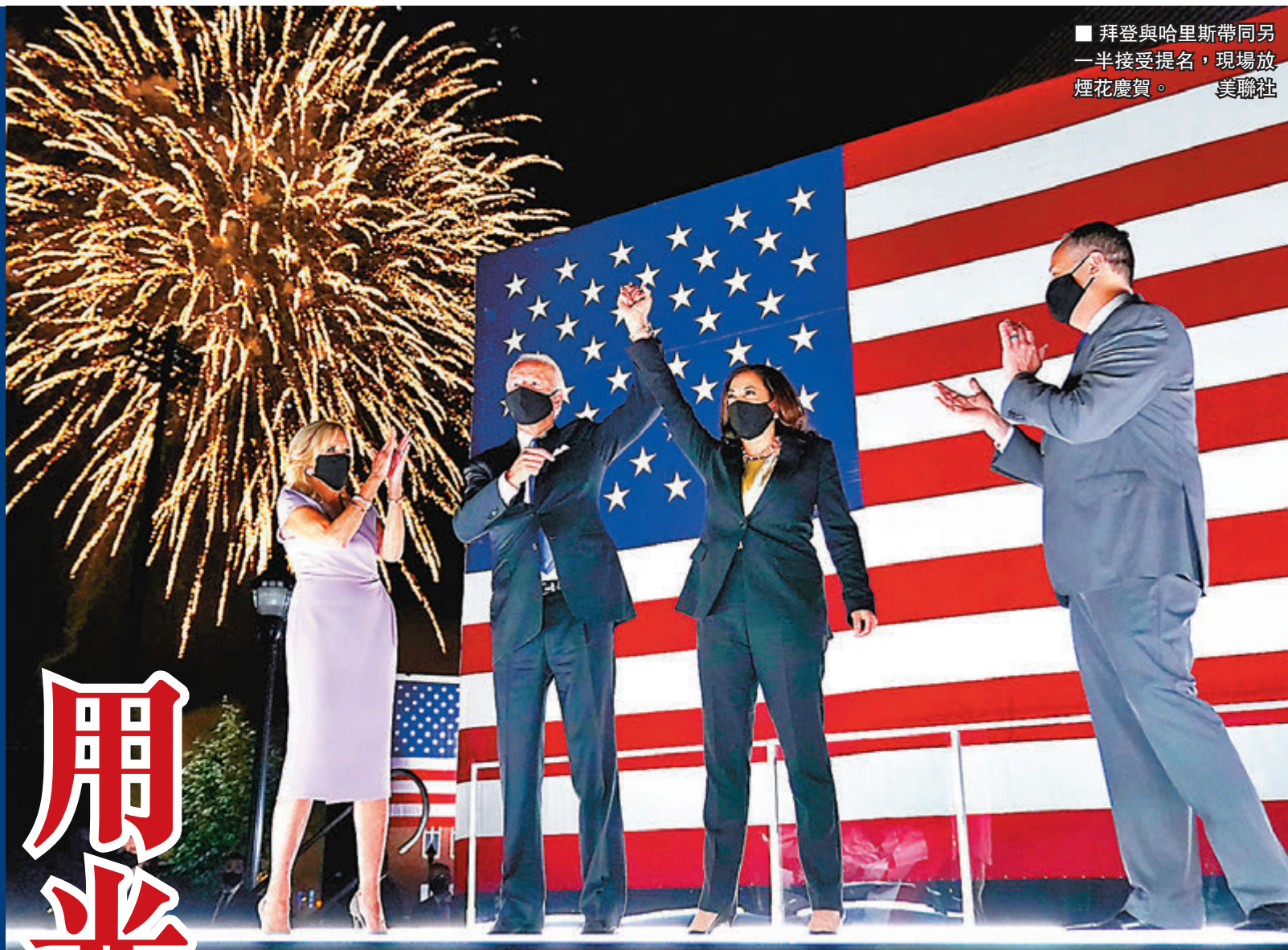
■ 拜登與哈里斯帶同另一半接受提名，現場放煙花慶祝。