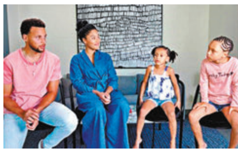
■ 史提芬居里一家在影片中現身。 網上圖片