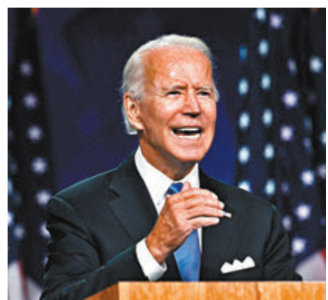
■ 拜登發表長達25分鐘、主題為「美國的承諾」的提名演說。

美國民主黨總統候選人拜登在最後一晚的民主黨全國代表大會上，發表正式接受提名演說。拜登形容美國現正同時面臨四大危機，承諾一旦當選，將會以完全不同於現任總統特朗普的方式去帶領國家，並提出包括抗疫等多項當選後將會採取的具體措施。拜登更將11月大選定性為「光明與黑暗」之爭，強調自己將會與光明為伍，呼籲選民以希望對抗恐懼，以事實對抗虛妄，團結一致度過黑暗。