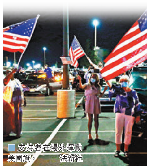
■ 支持者到場外揮動美國旗。

拜登最後呼籲支持者團結，「因為愛比恨更有力量，光明比黑暗更有力量」，形容11月大選是重拾美國靈魂的選舉，可改變國民的人生，「美國的黑暗篇章從此將告一段落」，又強調沒有絕對的結果，但「這是我們人民團結起來的時候」。 ■綜合報道