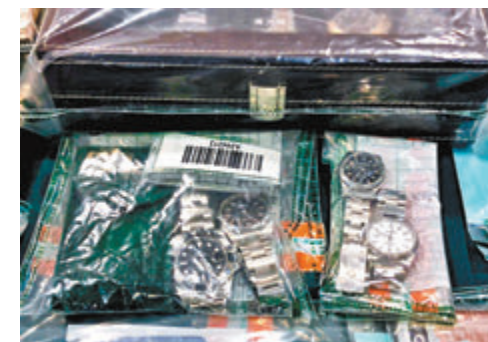
走私集團成員將犯罪收益購買名錶等貴重物品。