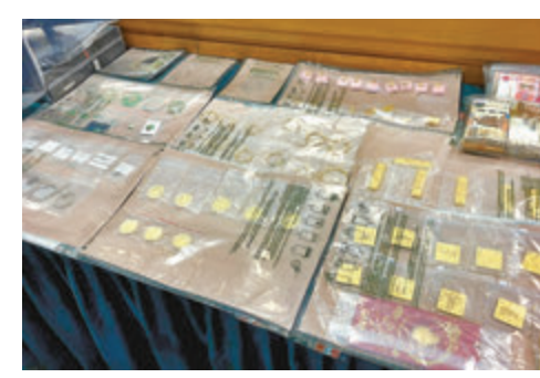
走私集團成員亦購買了不少金條、金牌及金飾。