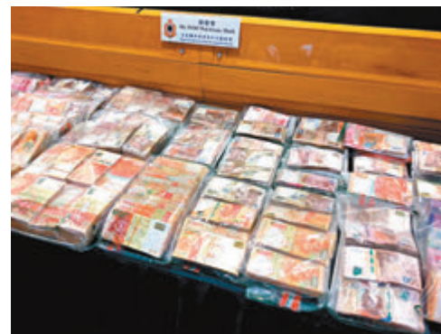
海關在行動中檢獲1,500萬元現金。

並繼續調查，了解凍肉有否流入本港市面。海關年初至今已破獲28宗同類案件，檢獲超過2,800噸凍肉，市值1.2億元，去年同期只有6宗相關案件，涉及330噸凍肉，貨值約1,200萬元。海關有組織罪案調查科高級監督胡偉軍估計，走私活動活躍，因內地凍肉入口關稅和增值稅達80%，成功走私的收益是成本近一倍。