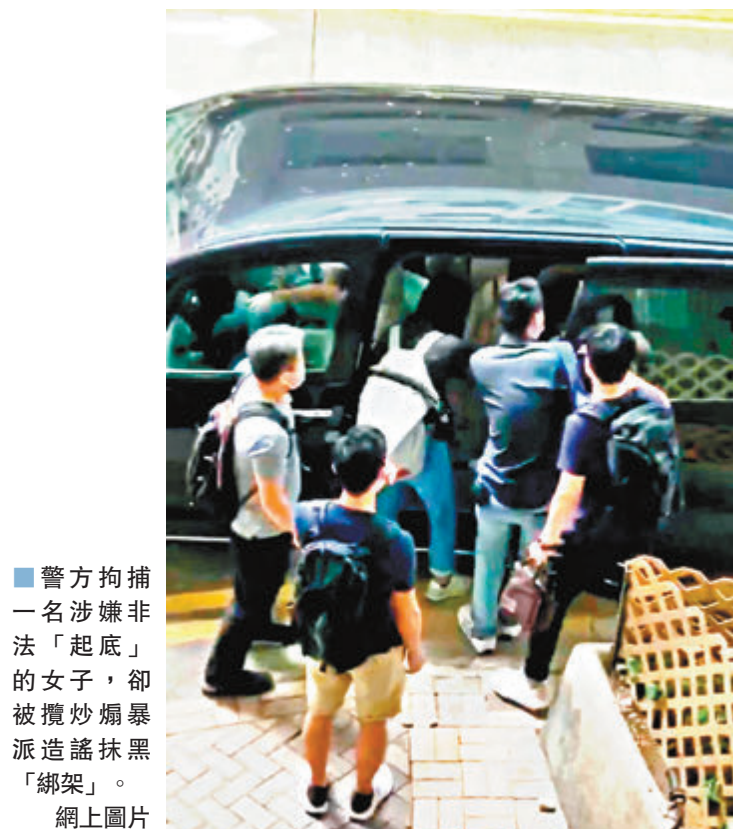
警方拘捕一名涉嫌非法「起底」的女子，卻被攪炒煽暴派造謠抹黑「綁架」。網上圖片