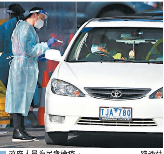
■政府人員為民眾檢疫。路透社

發地區，研究疫苗在不同年齡群中的功效，據此決定疫苗接種次序。他強調疫苗仍處於大規模測試初期，提醒各方不可完全依賴疫苗。 澳洲目前累計確診個案近2.4萬宗，約450人死亡。疫情嚴峻的維省昨日新增216宗確診，較兩周前每日平均新增700宗確診明顯好轉。莫里森指出疫情重創全球經濟，更奪去成千上萬人的生命，強調當局要採取最全面、完善的措施，才能讓澳洲重回正軌。他表示國民若提出醫學理由，可豁免接種疫苗，但這是唯一理據，對於強制接種可能引起反對疫苗人士抗議，莫里森表明抗疫為先，若任由病毒擴散，代價實在太大。 ■路透社/法新社