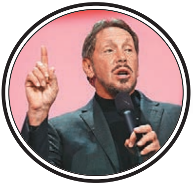
■埃利森(左圖)是特朗普支持者。

英國《金融時報》周一報道，甲骨文正考慮與其他私募基金聯手，從TikTok母公司字節跳動手上，收購TikTok在美國、加拿大、澳洲及新西蘭的業務，並已進行初步討論。 特朗普前日在亞利桑那州的競選活動上，大讚甲骨文是「好公司」、甲骨文老闆是「很好的人」，他相信甲骨文有能力處理收購TikTok一事。特朗普又重申「分成論」，指任何公司達成協議收購TikTok，都應向美國政府支付一定金額，稱由於是美國政府讓交易可成事，故財政部應獲「補償」。 幾從未涉足消費者市場 甲骨文是繼微軟及twitter後，第三家據報