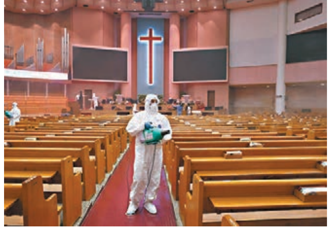
■韓國教會群組擴散。

韓國中央防疫對策本部表示，韓國昨日新增297宗新冠肺炎確診病例，是自上周五首都圈爆發群聚感染以來，單日病例最多的一天，亦是連續6天新增病例破百。政府稱當前處於「全國大流行危機」階段，呼籲全民齊心抗疫。 昨日新增的社區感染病例達283宗，當中有關首爾「愛第一」教會的群組感染個案增加166宗，累計達623宗。與該教會有關的疫情，從首都圈地區擴散至全國大部分地區，目前大邱市、忠南道、慶北道、大田市、江原道、全北道6大地區的相關病例累計25宗。由於