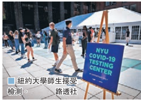
■紐約大學生接受檢測。

美國多間大學早前重開校園，讓學生回校上課，然而過去數日已有至少6個州份有學生確診新冠肺炎，多間大學決定全面回歸網