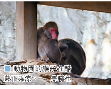
■動物園的猴子在酷熱下乘涼。

《朝日新聞》報道，據東京都監察醫務院統計，東京於本月14日至17日新增24人中暑死亡，8月以來已有103人熱死。中暑不治民眾有半數為60歲以上，而且均是在室內中暑，其中多數家中沒有安裝冷氣，又或有安裝冷氣卻沒有使用。 總務省消防廳統計，在本月10日至16日的一周內，日本全國共有12,804人因中暑送院，較前一周增加近一倍，東京都有1,574人中暑，在全國都道府縣中最多，其次是大阪府及愛知縣，分別有898人及791人中暑。 ■綜合報道