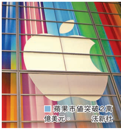
■蘋果市值突破2萬億美元。法新社

美國蘋果公司股價昨日早段上升1.3%，股價一度升至468.34美元，成為美國首間市值突破2萬億美元(約15.5萬億港元)的企業。 蘋果市值於2018年8月升破1萬億美元(7.75萬億港元)，短短兩年便翻倍。儘管受新冠疫情影響，導致各地部分蘋果專門店被迫暫時停業，在中國的廠房亦關閉，影響生產和銷售，但蘋果股價本年至今已升近60%。蘋果3周前宣布會將股份一拆四，令股份價格降低，被視為好消息，刺激股價顯著上升。 ■綜合報道