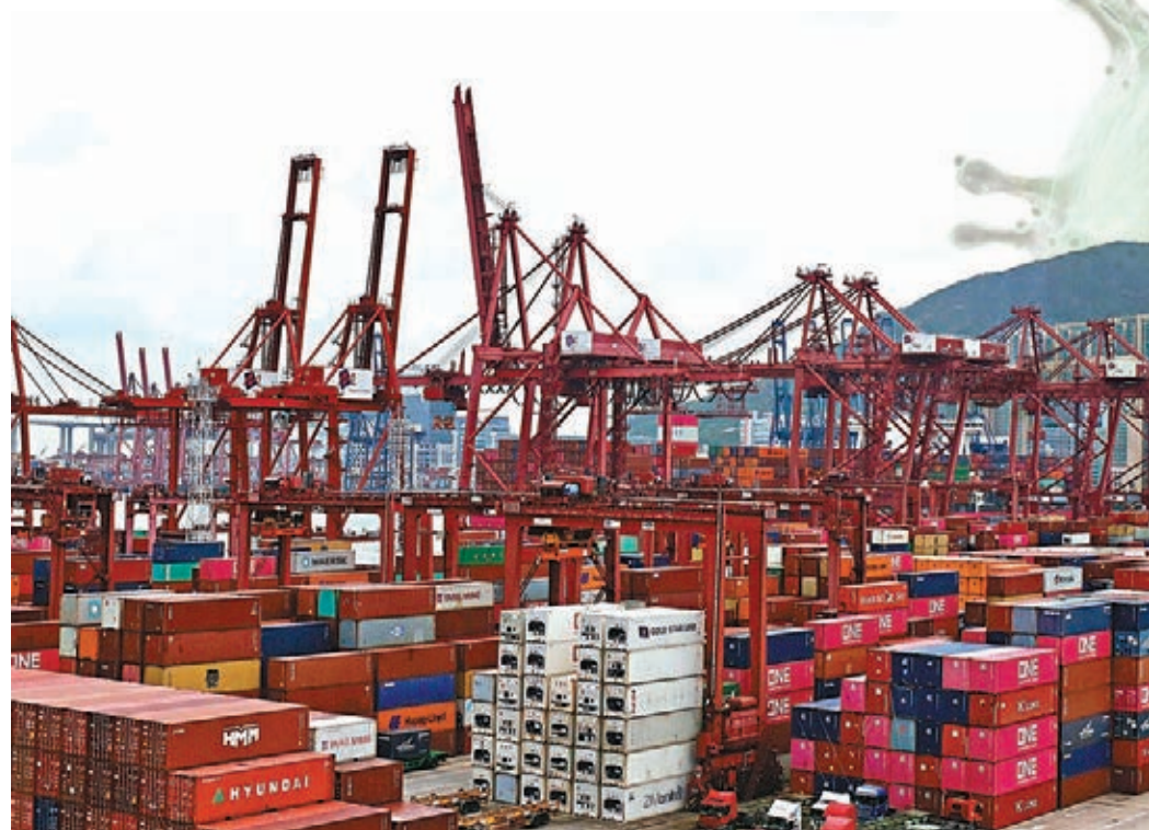
本港昨日新增36宗新冠確診個案，其中葵涌貨櫃碼頭群組再多一名宏記港務操作有限公司員工確診，該群組至今累計有66人確診。圖為葵涌貨櫃碼頭。

劉家獻表示，病人本月15日因腹痛等外科問題，獲安排入住仁濟醫院外科病房，入院後發燒。他留醫期間曾接受超聲波等檢查，前日（17日）腹痛停止，但仍有發燒，故被安排轉入負壓病房及接受病毒檢測，昨日被診斷為初步確診。