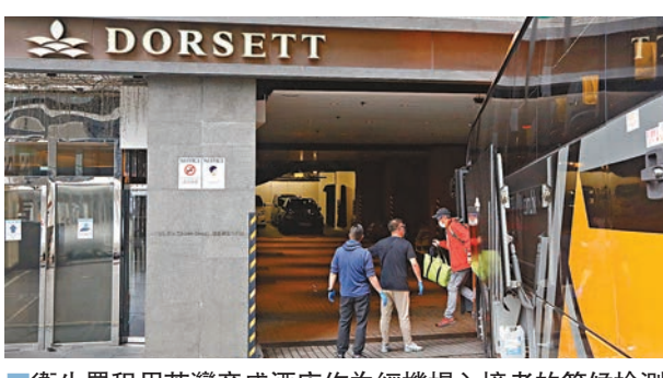
衛生署租用荃灣帝盛酒店作為經機場入境者的等候檢測結果中心，昨有旅遊巴接載入境者到達該酒店。

另外，衛生署前晚起租用荃灣帝盛酒店，以取代九龍城富豪東方酒店作為經機場入境者的等候檢測結果中