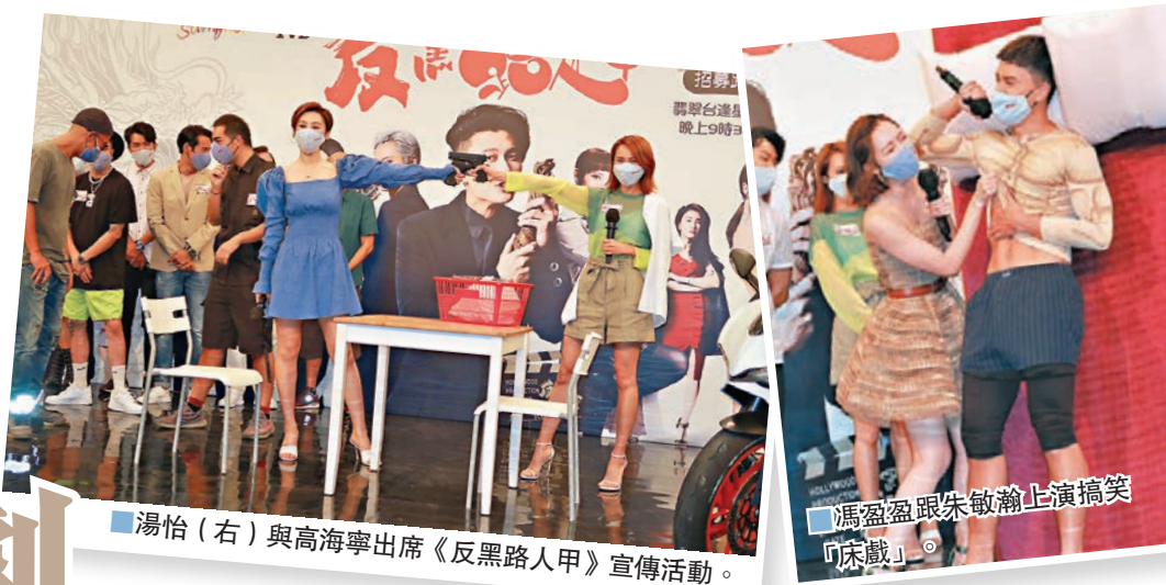
湯怡(右)與高海寧出席《反黑路人甲》宣傳活動。