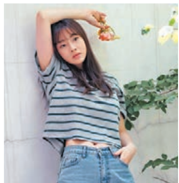
30歲的姜素拉宣布封盤嫁人。

據悉，姜素拉於2016年10月和《愛的迫降》男神玄彬開始交往。惟在2017年12月，玄彬所屬經理人公司確認，姜素拉已經與玄彬分手。姜素拉曾於2014年主演人氣韓劇《未生》。