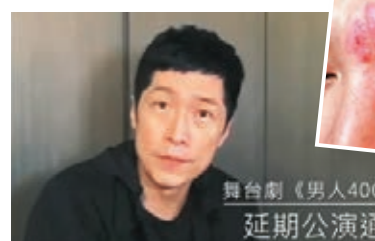
馬仔表示舞台劇延期至明年舉行，依然會是原班人馬上陣。