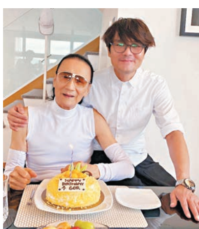
林家棟因拍戲跟向來風趣幽默的四哥成為好友。