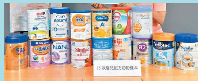
消委會檢測市面上15款嬰兒奶粉後發現，全部樣本均檢出污染物氯丙二醇（3-MCPD），長期過量攝入可損害腎功能和雄性生殖系統。