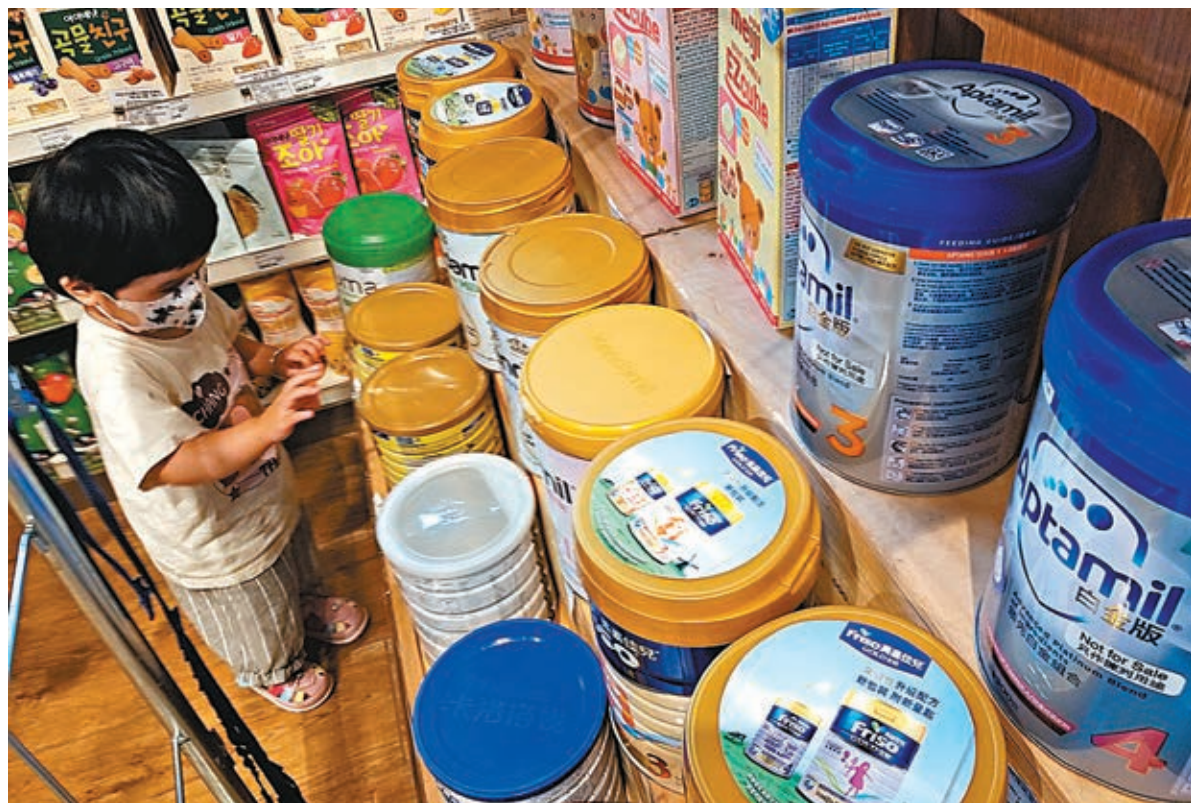
消委會檢測市面上15款嬰兒奶粉後，發現其中九個樣本驗出含致癌物縮水甘油酯（glycidyl esters, GE）。圖為小朋友在選擇嬰兒奶粉。

消委會研究及試驗小組主席譚鳳儀指出，檢測發現，全部15款奶粉均檢出3-MCPD，每公斤奶粉的3-MCPD含量介乎13微克至120微克。有研究發現，長期過量攝入3-MCPD可損害腎功能和雄性生殖系統。