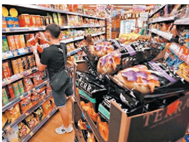
消委會測試市面77款薯片、蝦條等香脆零食，發現九成樣本含有致癌物丙烯酰胺（acrylamide）。

中心指出，這次消委會參考的歐盟標準是「健康參考值」，即建議嬰兒每日攝入的上限，並非就嬰兒配方奶粉所訂定的規管標準。參考聯合國糧農組織或世衛專家委員會的相關參考值，全部奶粉都無超標，呼籲家長放心按建議食用分量給嬰兒食用。