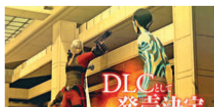
《真女神轉生3》高清版追加但丁DLC。

《Halo》新一集《Halo infinite》則宣布延至明年才上市，換言之未能成為XSX護航作。雖然暫缺《Halo》撐場，但微軟早前也在網上直播活動披露多款XSX新作，包括《超音鼠》創作人中裕司操刀的《巴蘭的異想奇境》，已被微軟收購旗下的Undead Labs力作《腐朽之都3》以及著名西洋RPG《神鬼寓言》的重製版等。另微軟明天也在PC推出超真實模擬飛行遊戲《Microsoft Flight Simulator》，Xbox Game Pass for PC用戶在遊戲上市首天即可免費玩到。至於世嘉最近也公布10月29日在PS4及Switch推出殿堂級JRPG《真女神轉生3》的高清版，而廠方也在發售當天提供可玩到《惡魔獵人》主角但丁追加劇情的收費DLC內容。