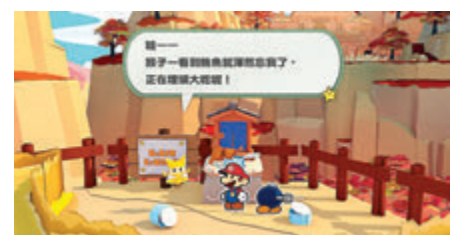
《紙片瑪利歐：摺紙國王》製作上充滿心思。

任天堂《瑪利歐》遊戲系列雖以橫向平面玩法為主，之後也積極在3D玩法大展拳腳，其中以「2D紙張角色活躍於3D立體世界」作賣點的《紙片瑪利歐》系列深受機迷擁戴，自NG4以來每代任系家用機都有作品推出。全新一集《紙片瑪利歐：摺紙國王》早前經已發售，講述瑪利歐在探望桃公主之際，發現蘑菇王國遭受摺紙國王侵襲，不單捉走公主還將所有住民變成摺紙敵人，令瑪利歐需發揮紙片力量破解五大紙帶封印。本作畫風與音樂素質甚高，而山嶺和房子等環境製作得相當別致，加上極像真紙的多邊形貼圖，令玩家猶如置身真正的紙片世界。遊戲的解謎成分亦高，不少都設計得很有意思，老幼咸宜；惟轉盤式戰鬥系統不掌握，或令輕量玩家卻步。任天堂最近也在官方網店舉行夏日精選優惠，於本月26日前可用七折價錢購買《火炎之紋章 風