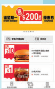
麥當勞應用程式優惠券

至於食肆方面，麥當勞應用程式則提供較多的現金券或優惠券給會員食客，平時星期一至五送$200起優惠券，今天起一連三個星期每周將有總值超過$400優惠券，只要直接開啟相關優惠，將相關二維碼展示給職員，即可享受相關優惠。同時，昔日是實體印花卡，現在可以在App內儲存印花，買滿特定數量即可免費獲得相關禮品。