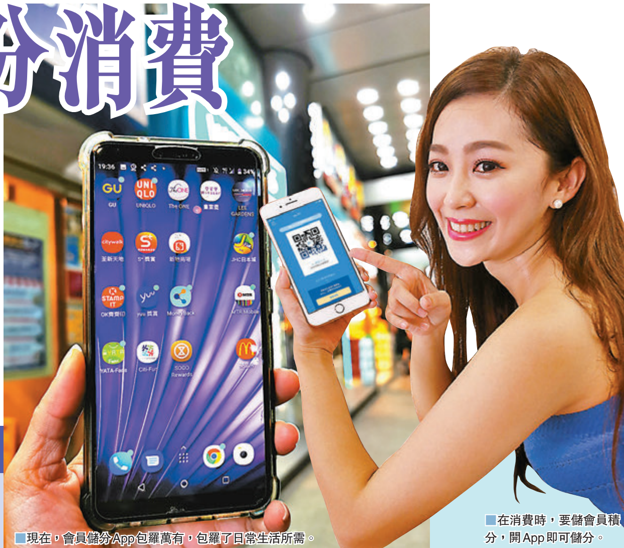
現在，會員儲分App包羅萬有，包羅了日常生活所需。

現在，購物消費儲分真的很容易，不少應用程式已內置了QR Code，會員開啟二維碼即可展示給職員一掃，即可儲分，簡單快捷。而有些應用程式則使用較複雜的方法，如一些商場應用程式，要會員購物後，於指定日數內，拍攝消費單據及電子收據，方可儲分。