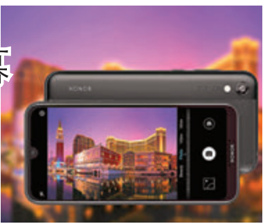
8S配備1,300萬像素後置主鏡頭

早前，榮耀香港宣布推出HONOR 8S，採用時尚簡約的設計，配備5.71吋HD+水滴螢幕，其雙重紋理的機身設計融合了啞光和光澤質感，提供經典外觀和獨特感覺，並使用超窄邊框設計，其19:9 FullView 水滴螢幕可實現高達84.6%的螢幕佔比。