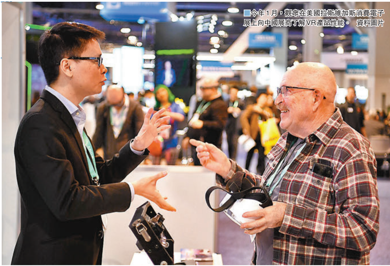
今年1月，觀眾在美國拉斯維加斯消費電子展上向中國展商了解VR產品性能。

發展不衝突、不對抗、相互尊重、合作共贏的中美關係，同時堅定捍衛國家主權安全發展利益。中國沒有興趣也從未干涉美國內政。美國應尊重中方核心利益和重大關切，立即停止任何干涉中國內政的言行。中方敦促美方與中方相向而行，加強各層級接觸對話，尋找雙方利益匯合點，保持正常人員往來，維護兩國關係民意基礎，推動中美關係回到以協調、合作、穩定為基調的正確軌道上來。