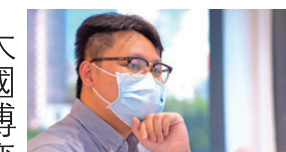
阿榮一針見血說：「實際上都是政治博奕、大國博奕的一種。」