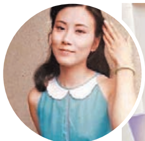
少女時代的汪明荃獲讚好清純。

阿姐昨日又分享了一張她少女時代輕撥秀髮在微笑,散發仙氣的照片,就連她也留言道:「不知道是那(哪)一年拍的照片?」不少圈中人和網民也讚阿姐清純。