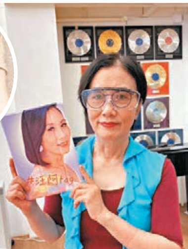
汪明荃收到今年的第一份生日禮物。