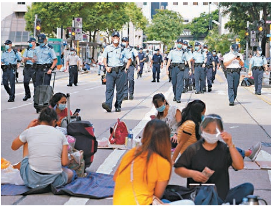
再有住過外傭宿舍的印傭染疫。

張竹君呼籲外傭僱主主動詢問履新的外傭是否曾入住長興大廈9樓，一旦有懷疑可與衛生防護中心聯絡，安排女傭接受新冠病毒檢測，「那裏不是僱傭中心