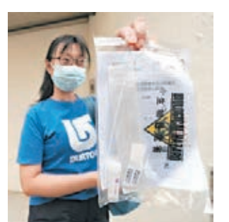
▲民政總署昨向竹園北邨松園樓居民派發檢測咽拭子採樣套裝和一盒口罩。