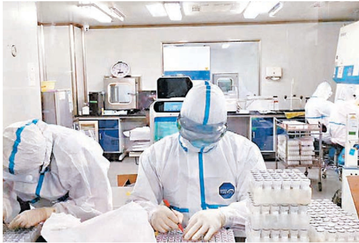
內地新冠肺炎疫情持續期間，凱普動用全集團之力高度重視戰疫工作。