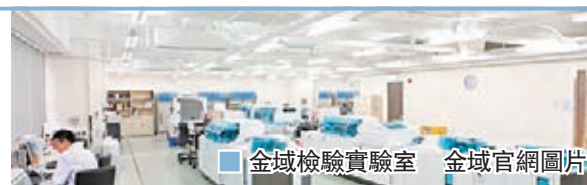
金域檢驗實驗室

根據華大基因網頁及內地媒體報道，華大基因於內地13個城市，包括北京、武漢、深圳等，成立了「火眼實驗室」，每日檢測量逾16萬人次。其「火眼實驗室」亦設於海外，包括澳洲、塞爾維亞，預計檢測量可達30萬人次。