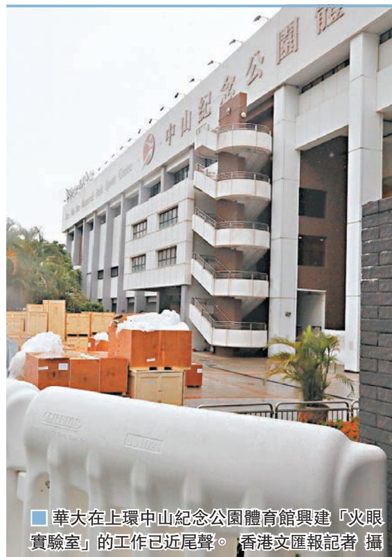
華大在上環中山紀念公園體育館興建「火眼實驗室」的工作已近尾聲。