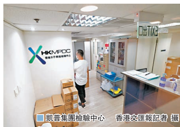
凱普集團檢驗中心