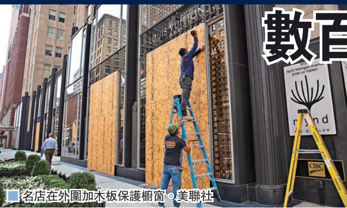
名店在外圍加木板保護櫥窗。