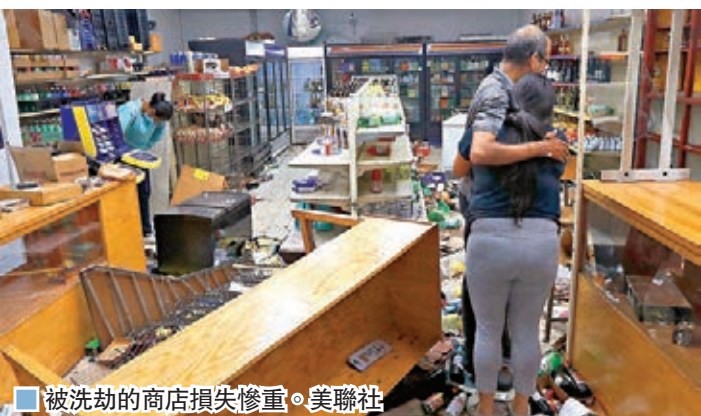
被洗劫的商店損失慘重。

美國芝加哥前日清晨發生大規模警民衝突及搶掠，數百名暴徒聽信網上流傳的警察打死人謠言後，破壞市中心多處商店並搶掠。警方出動400多名警員，拘捕過百人，更一度與暴徒交火，最少13名警察受傷，另有民眾中槍。市長萊特福特下令市區實施管制，但仍拒絕國民警衛軍進駐。