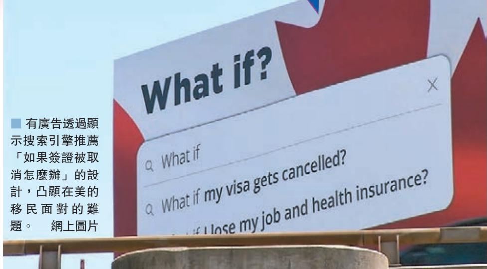
有廣告透過顯示搜索引擎推薦「如果簽證被取消怎麼辦」的設計，凸顯在美的移民面對的難題。網上圖片