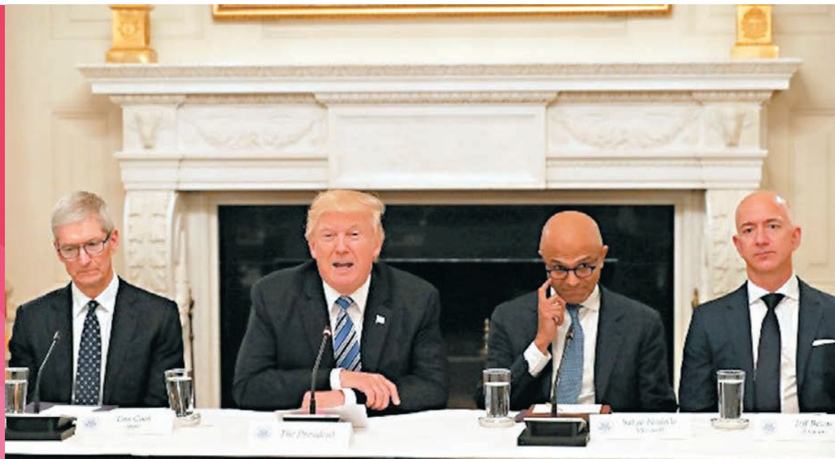
蘋果、Google及亞馬遜等巨企批評簽證禁令損害美國經濟及商界。圖為三位CEO 2017年與特朗普會晤。

美國總統特朗普早前簽署行政命令，暫停審批各項移民及工作簽證，依賴海外人才的科技企業首當其衝。蘋果公司、亞馬遜、微軟、facebook等52間科技企業，前日分別向法院呈交文件，批評簽證禁令對美國經濟及商界造成「不可逆轉傷害」，支持早前商界針對特朗普行政命令的訴訟。