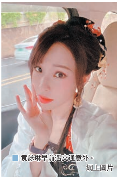
袁詠琳早前遇交通意外。