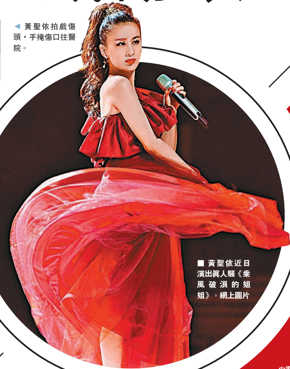
黃聖依近日演出真人騷《乘風破浪的姐姐》。網上圖片