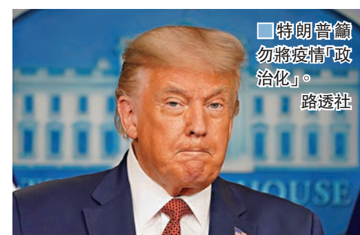
■特朗普籲勿將疫情「政治化」。