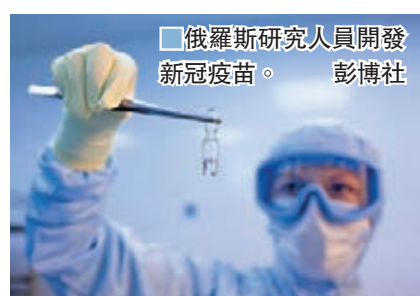
■俄羅斯研究人員開發新冠疫苗。

不過俄羅斯的疫苗只進行兩個月臨床實驗，且預料在今天才正式開始第三階段臨床測試，故其健康風險未能排除。世界衛生組織上周警告，俄羅斯當局需遵循疫苗研發指引，完成「所有必要的測試流程」，才能推出安全的疫苗。