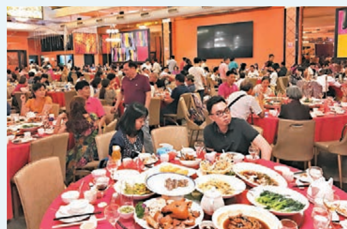
城鄉紅白事宴席鋪張浪費問題突出。圖為去年底廣州一對新人的婚宴，客人離席後大半菜品沒有吃完。資料圖片

習近平近日對制止餐飲浪費行為作出重要指示，指出餐飲浪費現象，觸目驚心、令人痛心，要進一步加強宣傳教育，切實培養節約習慣，在全社會營造浪費可恥、節約為榮的氛圍。對此，香港文匯報記者通過採訪市民和餐館負責人了解到，雖然公款吃喝、鋪張浪費等現象已明顯減少，但城鄉紅白事宴席浪費現象仍十分突出，倡導節約很有必要。業界指出，除了加強宣傳，還應建立起一套切實可行的約束機制，比如農村宴席浪費現象更難杜絕，可以設立鄉村監督員角色。