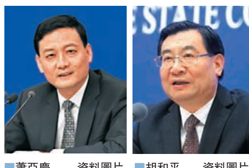
蕭亞慶 資料圖片 胡和平 資料圖片