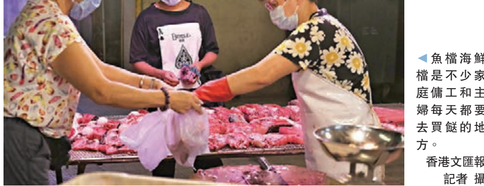
魚檔海鮮檔是不少家庭傭工和主婦每天都要去買餸的地方。