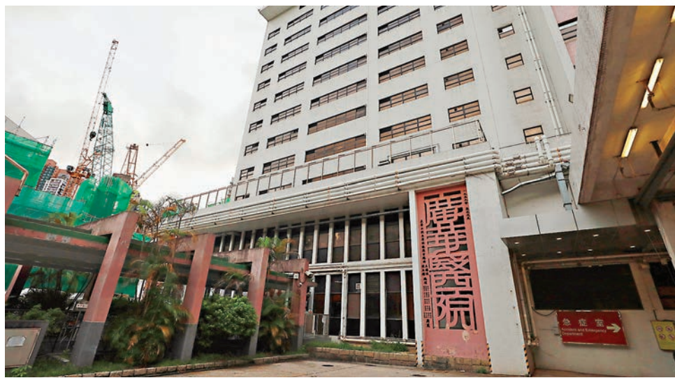
廣華醫院6病人染疫。

第三波疫情中，整體60歲以上患者比例上升一倍，長期病患者上升三分之一。他表示，冬季將有更多因中風、心臟病入院的病人，令急症室、內科的病床床位緊張，建議設立更多社區設施，集中照顧輕症病人，騰出醫院床位予有需要病人。