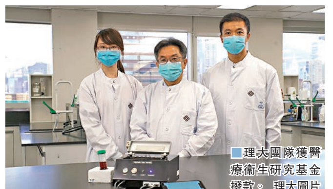
理大團隊獲醫療衛生研究基金撥款。

香港文匯報訊（記者 郭虹宇）疫情嚴峻，大學科研亦積極投入力量齊心抗疫。就食衞局醫療衛生研究基金最新一輪撥款，理工大學共八個項目獲批逾1,800萬元資助，其中針對新冠病毒檢測，該校團隊致力將繁複的化驗室流程轉化成簡便技術，製作成便攜式的手提儀器，希望能於機場、關口、港口、診所等場所，就懷疑患者進行快速篩查，估計僅需30分鐘，即可判斷是否感染，以更有效支援檢疫策略。