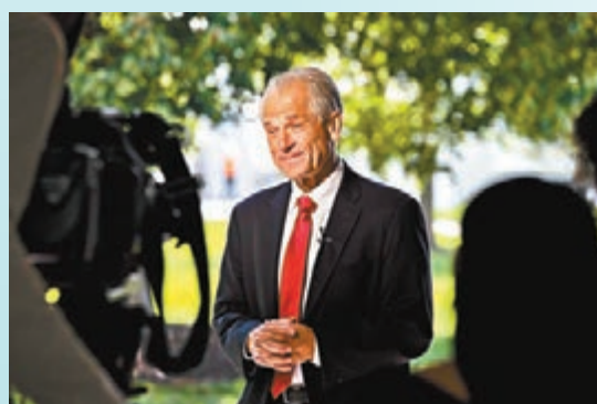
納瓦羅指控姆努奇恩對華軟弱。