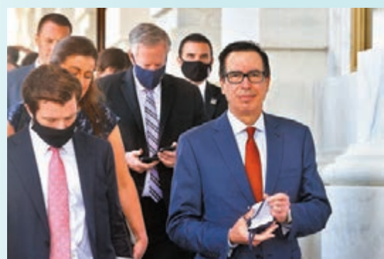
姆努奇恩(右)主張收購TikTok美國業務。