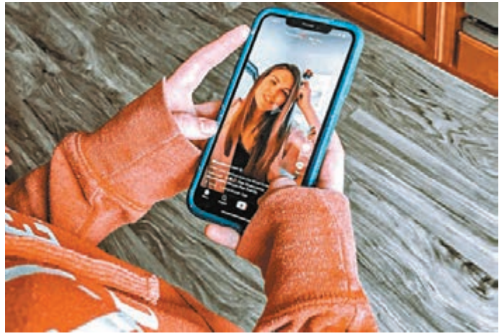
華府毫無根據宣稱TikTok對美國構成國家威脅。網上圖片

美國總統特朗普上周四簽署行政命令，禁止美國企業或公民在45天後，與影片分享平台TikTok及通訊程式WeChat(微信)的母公司交易。美國傳媒前日引述知情人士報道，TikTok最快明日入稟法院，起訴特朗普的行政命令違憲、TikTok構成國家安全的指控毫無根據。