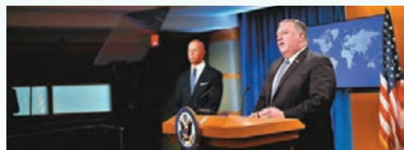
蓬佩奧今日啟程出訪中歐及東歐。