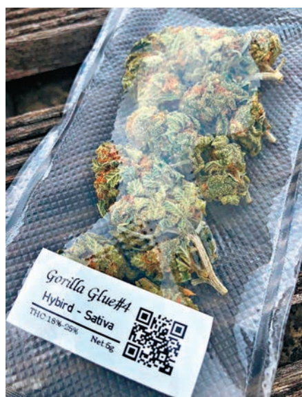
賣家展示大麻貨辦。

全球愈來愈多國家或地區將消閒用途的大麻合法化。這些國家的生產商研發出五花八門的大麻製品，包括大麻糖果、朱古力、餅乾、能量棒、蛋糕等等，加上包裝精美，容易使消費者忽視其有害成分。香港對大麻製品有嚴格入口限制，市民從有關地區購入大麻糖果零食時，若發現產品上印有THC或Cannabis（大麻英文名）等字眼，千萬不要帶返香港，以免誤墮法網。