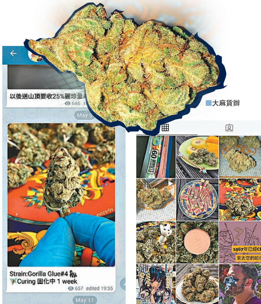
大麻群組上，賣家展示大麻貨辦。賣家展示五花八門的大麻貨辦。

新冠肺炎肆虐下，傳統毒品銷售渠道酒吧及娛樂場所關閉，毒犯遂轉戰網上平台，警方早前展開掃毒行動就拘捕41人涉嫌販毒，檢獲總值約132萬元的懷疑大麻等毒品。香港文匯報記者放蛇亦發現，香港的大麻地下市場極猖獗，拆家除了在社交平台上大肆進行宣傳，更以「外賣車」將大麻送到買家府上。拆家更將大麻美化為「腦洞大開」、「解決煩惱」的「恩物」，標榜其純度極高，7克售700元。除了大麻網店，有癮君子在接受香港文匯報訪問時更爆料指，尖沙咀部分舊樓公然設立毒品賣，出售大麻，甚至海洛英。