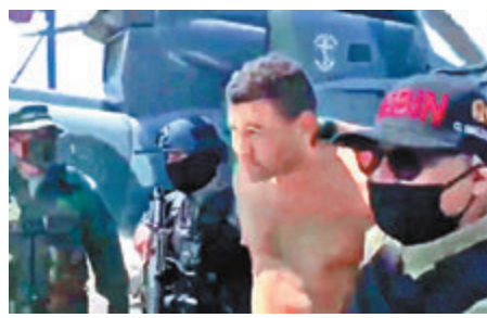
美傭兵被捕，將囚20年。資料圖片

34歲的登曼和41歲的貝里隸屬佛羅里達州一間私人保安公司，他們承認參與「流亡軍」的入侵行動，目標是推翻委內瑞拉總統馬杜羅，而美國則幕後支持這宗陰謀。但華府已否認，聲稱對事件全不知情，美國國務卿蓬佩奧則表示，華府將採取一切方法，讓兩人重獲自由。委內瑞拉檢方起訴兩人非法偷運武器