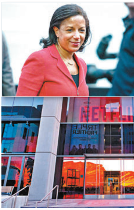
蘇珊賴斯被傳拜登副手大熱門人選。資料圖片