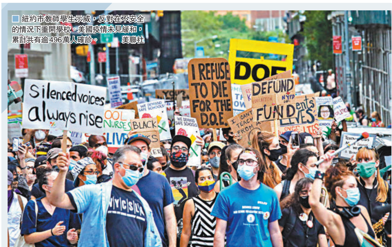
紐約市教師學生示威，反對在不安全的情況下重開學校。美國疫情未見緩和，累計共有逾496萬人確診。