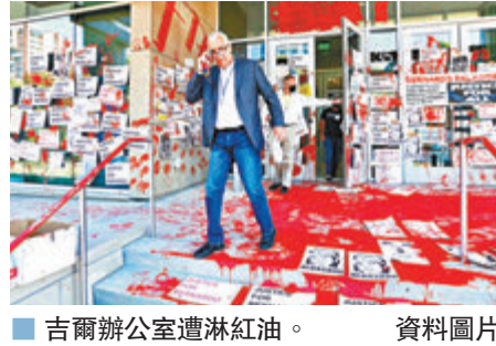
吉爾辦公室遭淋紅油。

根據檢方起訴書，7人被控多項刑事罪名，包括購買或運送漆油、向政府財物淋漆等。有示威者表示，對於可能被囚終身感到震驚和害怕。鹽湖城市長門登霍爾批評檢方方向示威者加控「黑幫行為」的罪名，稱違法者需承受後果，但不應因購買漆油而面臨終身監禁，形容控罪過分嚴苛。辯方代表律師指出，由於案件發源地為吉爾的辦公室，加上示威者多次高呼辱罵吉爾，檢方的提控明顯屬報復。