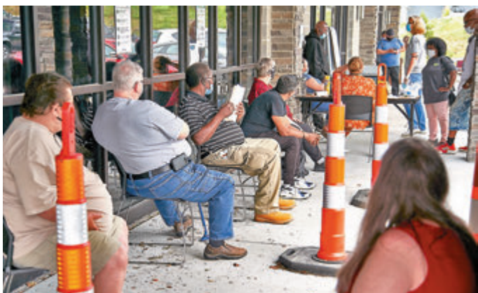
美失業補助金停止發放，失業者在等候解決方案。資料圖片

非完美解決方案，但確實在總統行政命令會將補助金延長至今年底。白宮幕僚長梅多斯則稱，行政命令並