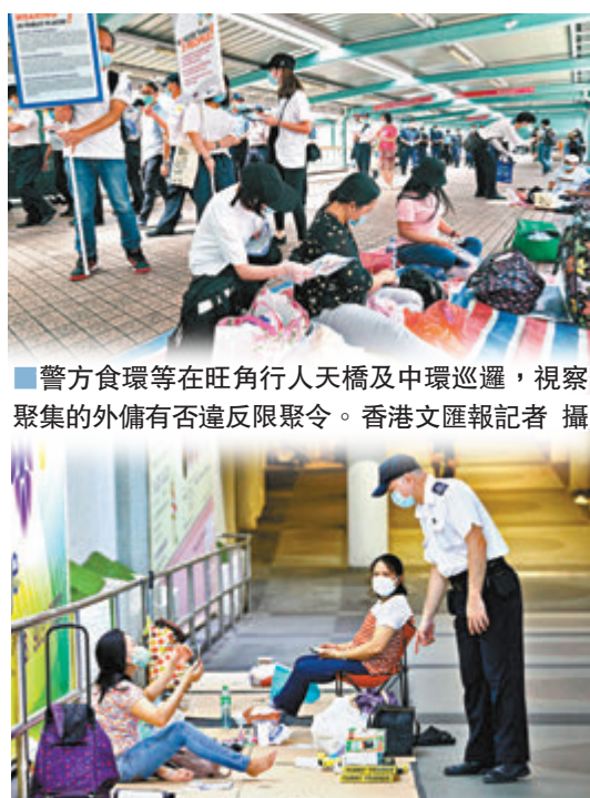
警方食環等在旺角行人天橋及中環巡邏，視察聚集的外傭有否違反限聚令。香港文匯報記者攝

香港文匯報訊（記者 文森）接連有外傭確診新冠肺炎，警方昨日聯同食環署、入境處及勞工處人員到各區外傭聚腳地巡邏，提醒他們需要佩戴口罩及遵守「限聚令」，否則會被票控。有外傭向香港文匯報記者透露，離鄉別井最需要鄉里支持，即使疫情肆虐，有外傭不惜與五六名好友租酒店房間於假日聚會。