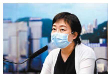
張竹君警告若市民有所鬆懈，確診數字可能再反彈。

爆發經驗，市民不應太擔心，全民檢測亦可找到部分隱形傳播者，高危群組包括安老院舍工作人員，則值得進行周期性檢測。