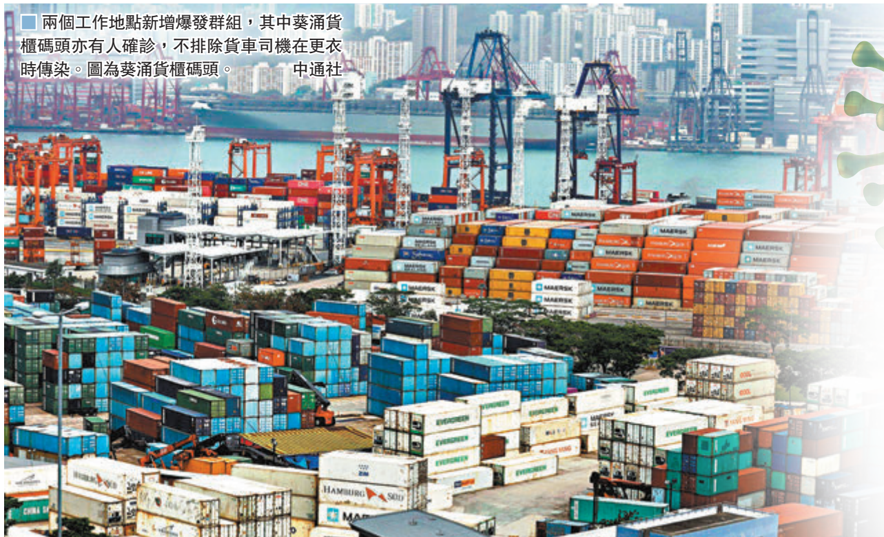
兩個工作地點新增爆發群組，其中葵涌貨櫃碼頭亦有人確診，不排除貨車司機在更衣時傳染。圖為葵涌貨櫃碼頭。

東區醫院綜合內科及老人科病房三名病人初步確診。院方指出，該病房的住院病人周三接受病毒測試，結果均呈陰性，院方按既定安排，昨日再為病人進行病毒檢測，結果顯示三人初步確診。當中70歲及78歲病人為早前確診個案的密切接觸者，兩人已於周三轉往隔離病房；另一名64歲病人則為同一病房但入住不同病格的病人。院方會調查個案是否與早前確診個案有關連，有關病房繼續暫停收症及出院。