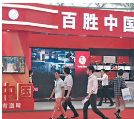
美國對中資企業咄咄逼人，將加快企業回流香港上市，百勝中國就是其一。資料圖片