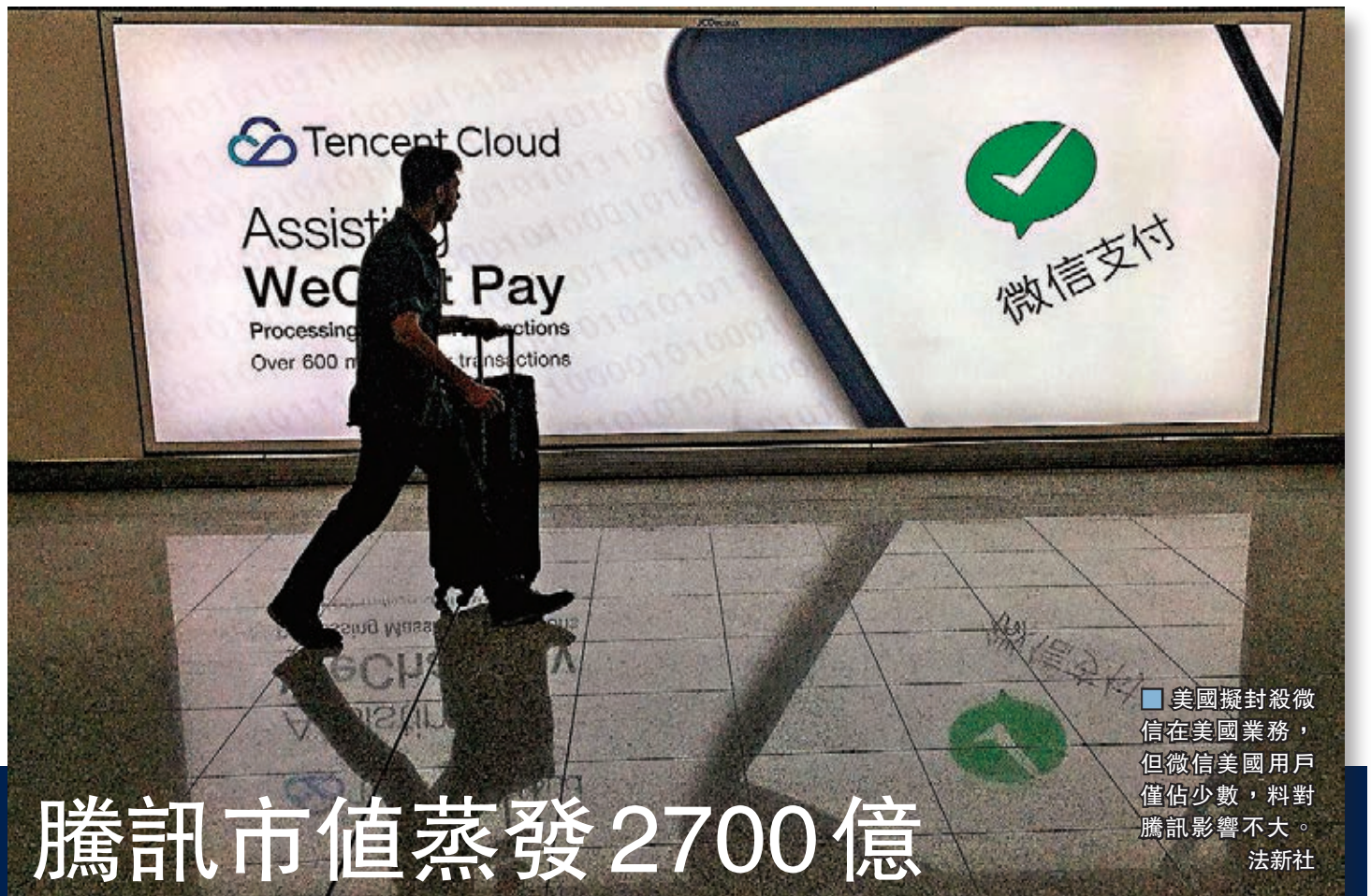
美國擬封殺微信在美國業務，但微信美國用戶僅佔少數，料對騰訊影響不大。