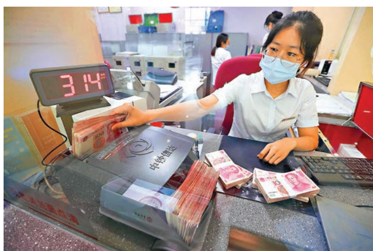
中國7月末外匯儲備增至3,154.4萬億美元，較上月末增加421億美元，連續四個月上升並創2018年初以來最高。資料圖片