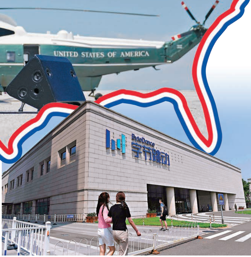
字節跳動批評華府試圖干涉私營企業之間的協商。