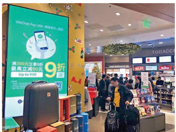
美國不少地方都有微信蹤影。圖為洛杉磯機場。