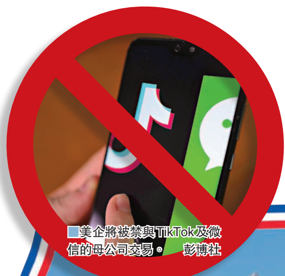
美企將被禁與TikTok及微信的母公司交易。