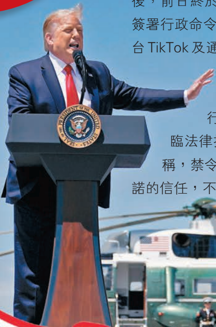
特朗普再次引用國家安全作為頒布禁令的理據。

華府預告打壓中國科企多日後，前日終於出手，總統特朗普簽署行政命令，下令禁止美國企業與影音分享平台TikTok及通訊程式微信的中國母公司、即字節跳動及騰訊交易，45天後生效。特朗普再次引用國家安全作為禁令的理據，不過行政命令條文模糊、法律理據不明，勢必在美國國內面臨法律挑戰，美國專家亦分析，中方必會反制。字節跳動回應稱，禁令沒有遵循正當法律程序，會破壞全球企業對美國法治承諾的信任，不排除訴諸美國法院。