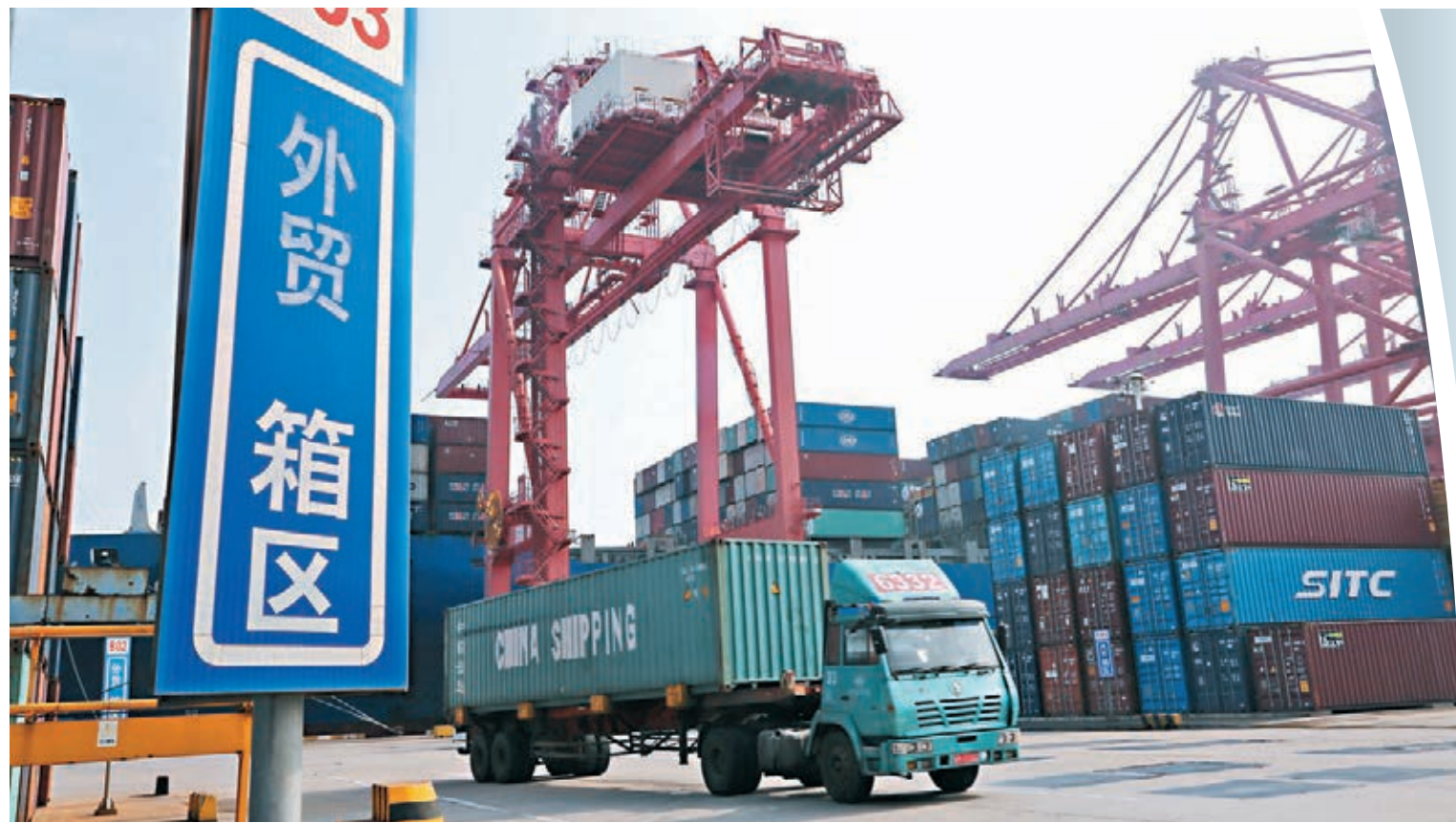
中國內地7月出口按人民幣計同比增長10.4%，較6月加快6.1個百分點，增速創去年3月以來新高。圖為江蘇連雲港港貨櫃碼頭。資料圖片

香港文匯報訊(記者 海巖 北京報道) 隨着海外經濟活動恢復和防疫物資出口持續高增長，中國內地7月出口繼續超預期增長，按人民幣計同比增長10.4%，較6月加快6.1個百分點，增速創去年3月以來新高，對美出口增速亦升至12.5%的年內高點。受7月出口大增帶動，今年前7個月出口同比微降0.9%，基本上恢復到去年同期的水平。