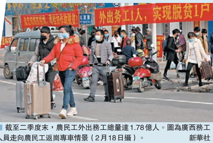
截至二季度末，農民工外出務工總量達1.78億人。圖為廣西務工人員走向農民工返崗專車情景(2月18日攝)。

在優先保障貧困勞動力穩崗就業方面，中央有關部門提出措施，優先組織貧困勞動力有序外出務工，為其優先提供轉崗就業機會。同時，通過工程項目建設、以工代賑、扶貧龍頭企業和扶貧車間等方式，提供更多就近就業機會。此外，聚焦重點地區攻堅，將52個未摘帽貧困縣、「三區三州」等深度貧困地區、易地扶貧搬遷大型安置區以及湖北等受疫情影響嚴重地區作為重中之重，給予更大支持。