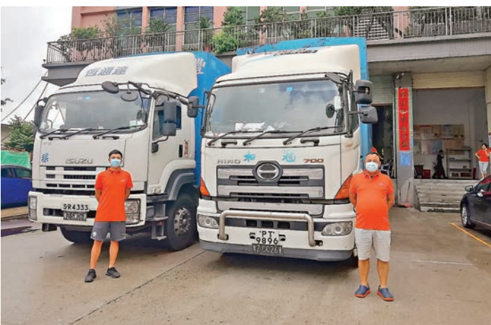
香港跨境司機何先生（右）和楊先生（左）均期盼香港疫情早日得到控制，目前他們的工作因疫情受到了不少影響。

在貨物供應方面，他表示，公司絕大部分貨物運輸範圍也在大灣區深圳、東莞、廣州和惠州等九市，影響不大，來自梅州、茂名和潮汕貨物不多，公司會指派內地司機運輸，回到深