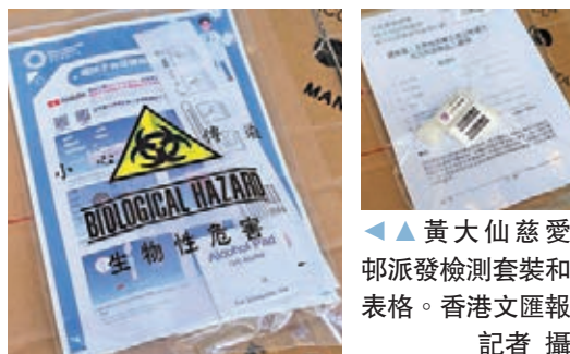
▲▲黃大仙慈愛苑派發檢測套裝和表格。

民政事務總署同日宣布，有鑑於較早前出現香港首宗分娩孕婦及嬰兒同時出現確診情況，仁濟醫院董事局於下周一至下周五在11個指定派發地點向孕婦（或由其他人代領）派發檢測登記表格