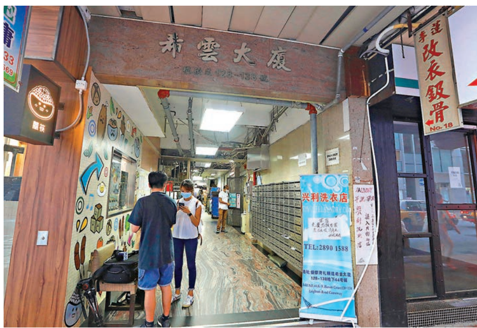
日前確診印傭也曾住過銅鑼灣禮頓道希雲大廈。

聯同其他政府部門到全港不同地方就限聚令進行聯合執法行動，以提高市民防疫意識，並促外傭僱主提醒家中傭工，在公眾地方進行群組聚集的人數限制已收緊至兩人，聚集亦要注意適當社交距離，否則將會被票控。