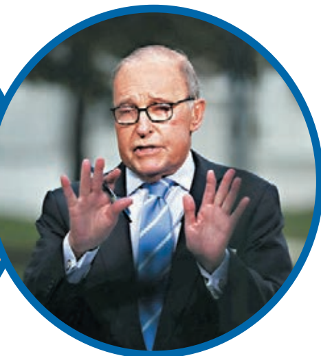
■ 庫德洛表示華府目前對如何分成沒有明確計劃。