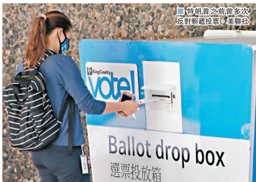
■ 特朗普之前曾多次反對郵遞投票。

美國總統特朗普此前多次反對郵遞投票，堅稱此舉損害選舉公正，但他前日一反常態，聲稱鼓勵佛羅里達州選民以任何形式進行投票。佛州已有190萬民主黨籍選民及130萬共和黨籍選民登記使用郵遞投票。特朗普前日稱，佛州選舉制度「安全且有保障」，由於共和黨多次阻止民主黨企圖更改制度，令選舉制度保持「乾淨」，「所以在佛州，我鼓勵大家郵遞投票！」