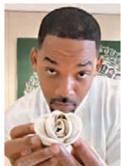
■ 威爾史密斯和瑪麗嘉兒等名人都有用抖音或TikTok。網上圖片

全球手遊及應用程式情報平台 Sensor Tower 昨日發布的數據顯示，今年7月抖音及海外版TikTok，在全球 App Store 和 Google Play 吸金超過1.02億美元(約7.9億港元)，是去年同期的8.6倍，再次位列全球流動應用程式(非遊戲)收入榜冠軍，其中約89%的收入來自抖音。而作為最近備受關注的TikTok事件主戰場，美國市場在抖音及TikTok收入中排名第二，貢獻6%收入。