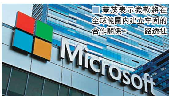
■ 蓋茨表示微軟將在全球範圍內建立牢固的合作關係。