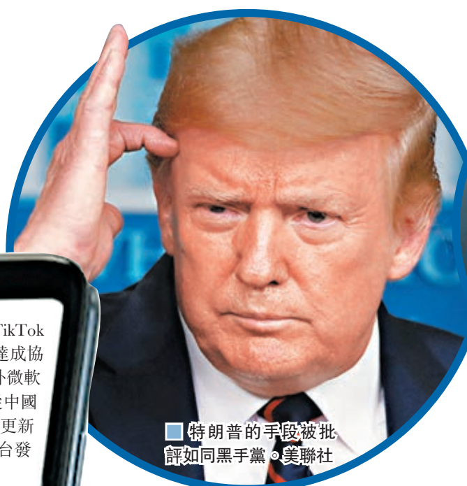
■ 特朗普的手段被批評如同黑手黨。

美國總統特朗普強迫中國字節跳動公司，將TikTok美國業務出售給微軟，周一更聲言華府應該在交易中「收佣」，言論惹來各界猛烈抨擊，批評特朗普的手段如同黑手黨，更可能違憲。華府官員明顯亦對分成一事甚有保留，白宮發言人前日兩度拒答相關問題，經濟顧問庫德洛更坦言，未確定如何從這交易中分成。