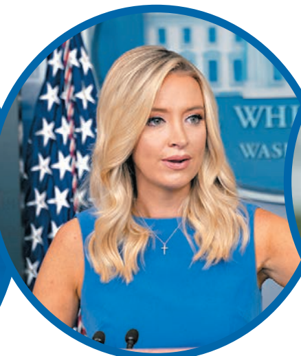
■ 麥肯納尼重申美國將對有中資背景的應用程式採取行動。彭博社