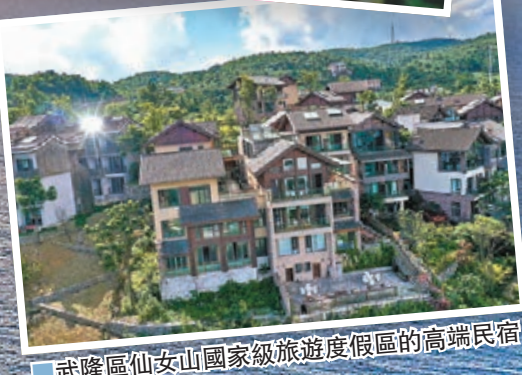
■武隆區仙女山國家級旅遊度假區的高端民宿歸原小鎮的特色民宿