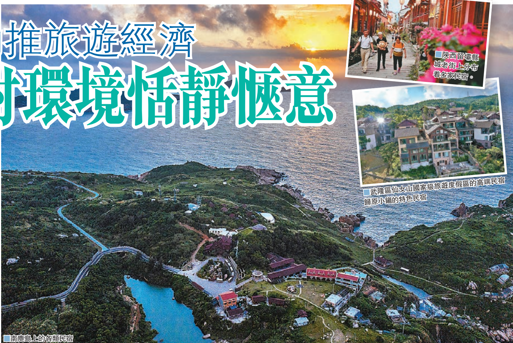
■南麂島上的各類民宿