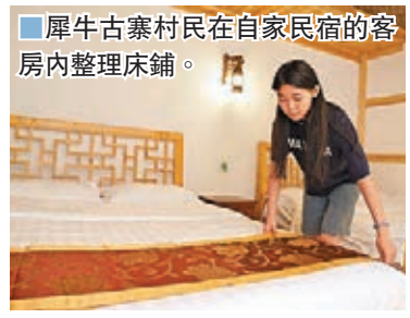
■犀牛古寨村民在自家民宿的客房內整理床鋪。