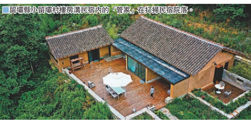
■留壩縣小留壩村樓房溝溝房內的「管家」在打理民宿院落。