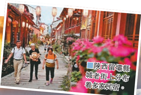
■陝西留壩縣城老街上分布着多家民宿。