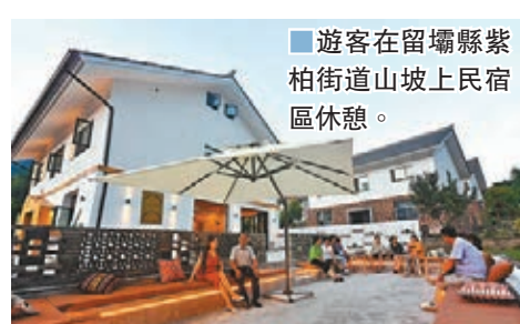
■遊客在留壩縣紫柏街道山坡上民宿區休憩。

陝西省漢中市留壩縣地處秦嶺南麓腹地，森林覆蓋率達91.23%，境內生態環境優越，素有「天然氧吧」之稱。近年來，當地政府依託秦嶺獨特的生態優勢打造豐富的旅遊產品，積極發展特色精品民宿產業，讓遊客享受恬靜愜意的山居生活同時，促進當地群眾就業增收。