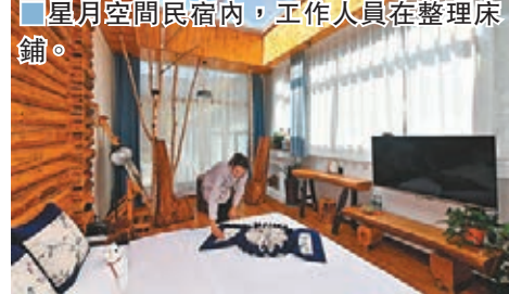
■星月空間民宿內，工作人員在整理床鋪。