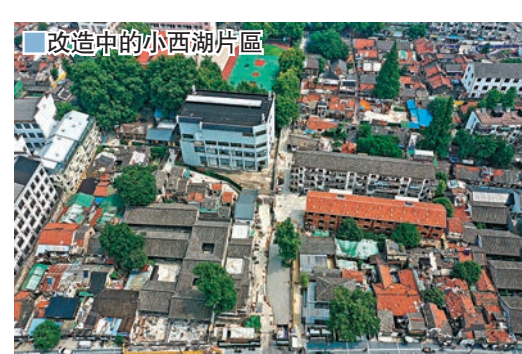
■改造中的小西湖片區