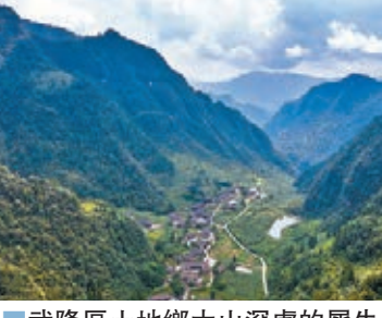
■武隆區土地鄉大山深處的犀牛古寨