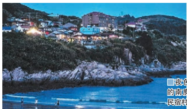
■夜色中的南麂島民宿村