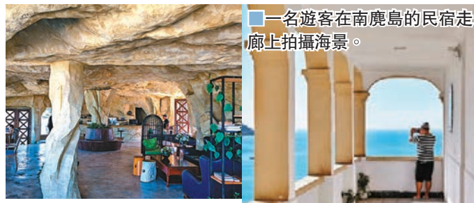
■一名遊客在南麂島的民宿走廊上拍攝海景。

近年來，浙江省溫州市平陽縣南麂鎮依託海島旅遊資源優勢，積極發展海島特色民宿經濟，按照「一村一品」布局，依山面海、臨海而居，打造風格多樣的小木屋、帳篷酒店、懸崖酒店等特色民宿，同時全面提升道路、沿街商舖、民宿外觀設計、民宿服務質量等軟硬件水平。目前南麂鎮擁有各類民宿50多家，去年帶動包括餐飲、住宿、零售等各類旅遊收入1億多元，全面助推了海島旅遊經濟的發展。