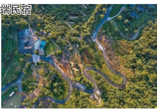
■高端民宿歸原小鎮

地處武陵山區的重慶市武隆區，山高溝深、地少土瘠。近幾年，武隆圍繞高山生態特之以恒推動生態產業化、產業生態化，打造大景區聯動產業。當地依託「綠水青山」的環境優勢，在引進高端民宿進行示範帶動的同時，積極引導村民將農村閒置住宅逐步改造成特色民宿，如武隆區土地鄉大山深處的犀牛古寨，以及武隆區仙女山國家級旅遊度假區的高端民宿歸原小鎮等，帶動鄉村旅遊，為鄉村振興注入活力。