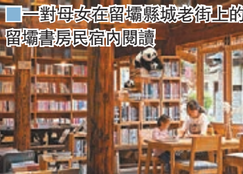
■一對母女在留壩縣城老街上的留壩書房民宿內閱讀