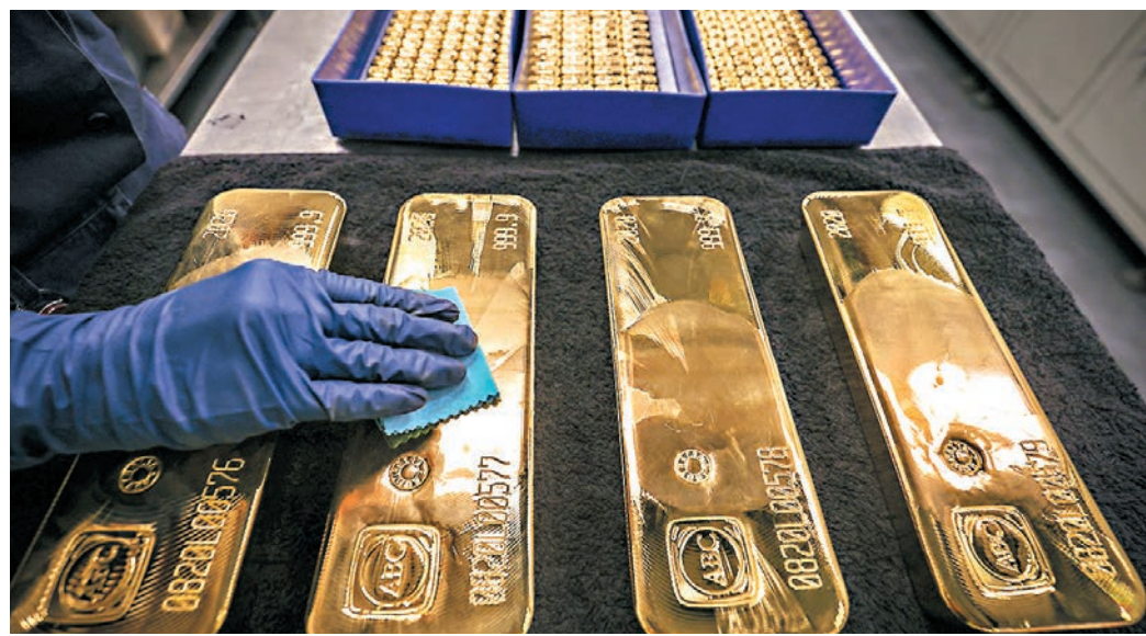
■高盛認為，當前環境是政府正將貨幣貶值，令黃金成為萬不得已的「貨幣」。

港股十大成交股份中，過半由科技股主導。受惠新經濟股及愈來愈多中概股在港上市，刺激港交所(0388)再創新高，全日升2.4%報386元。