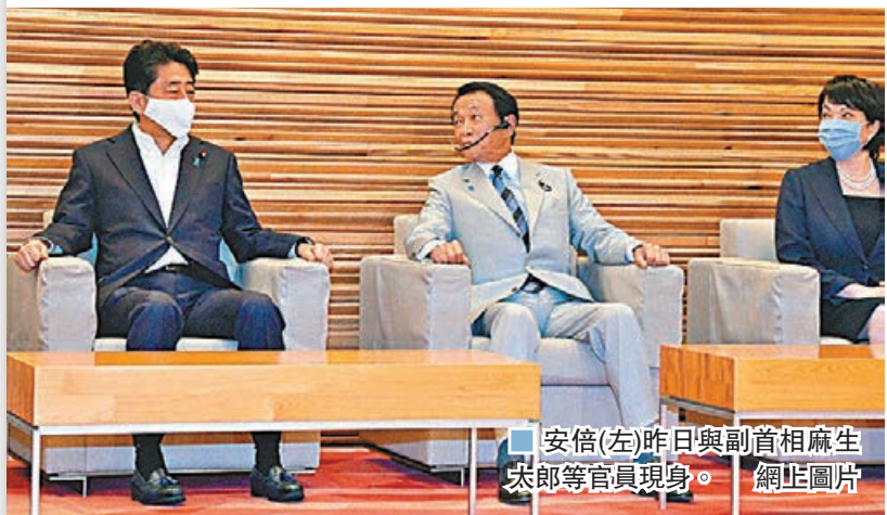
安倍(左)昨日與副首相麻生太郎等官員現身。

日本首相安倍晉三再度傳出健康問題，日本《FLASH》周刊昨日報道，安倍上月曾在首相官邸吐血，並曾向幕僚表示「已經沒時間了」，不排除突然辭職。內閣官房長官菅義偉昨日回應報道時，強調安倍健康完全沒有問題。