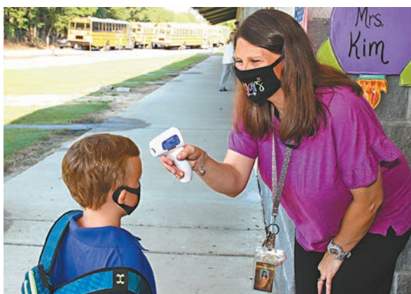
密西西比州有學校復課，學童進校時接受體溫檢測。

部分嘗試復課的州份陸續爆發疫情，其中佐治亞州格威納特縣復課短短一周，已經錄得感染個案，多達260名密切接觸者需隔離，田納西州和密西西比州亦有學生確診。