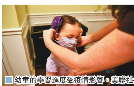
幼童的學習進度受疫情影響。

聯合國秘書長古特雷斯昨日警告，學校因新冠肺炎疫情被迫關閉，可能導致全球面臨「世代災難」，他表示「優先要務」就是讓學生安全返回校園。