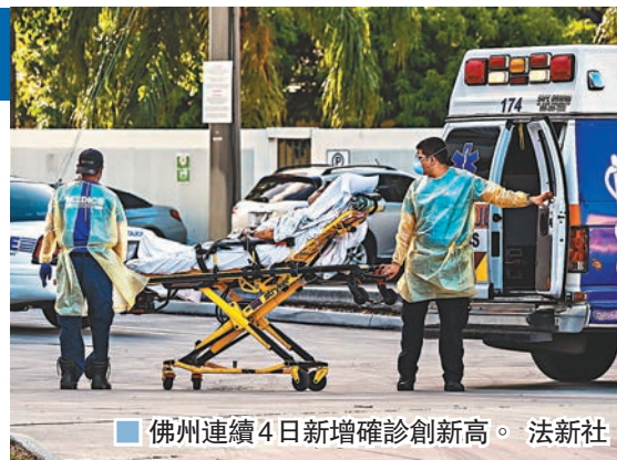
佛州連續4日新增確診創新高。