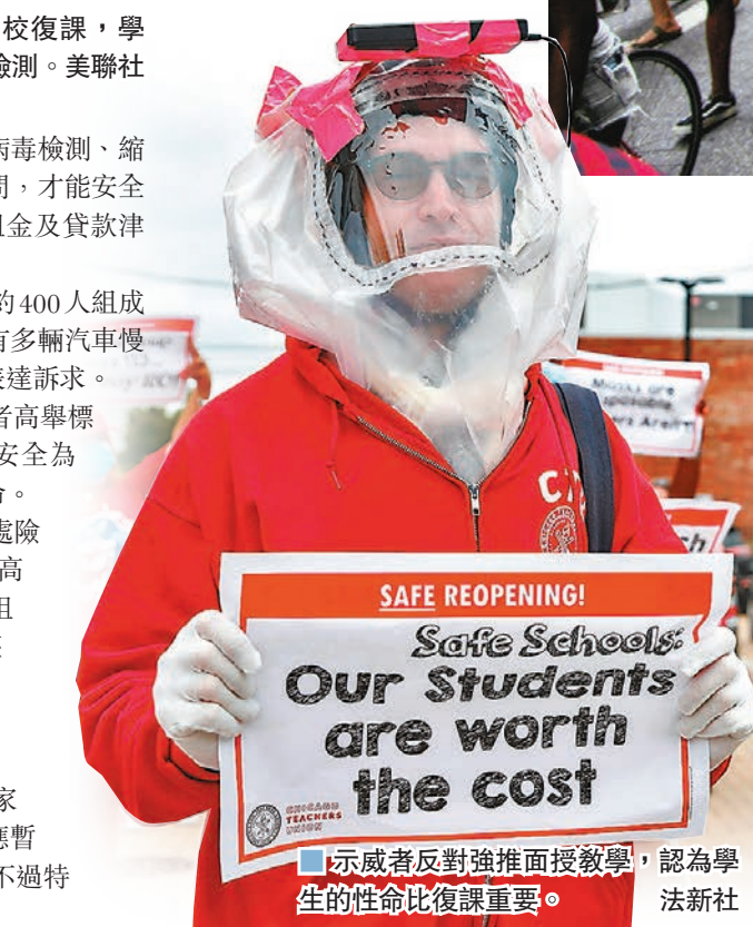
示威者反對強推面授教學，認為學生的性命比復課重要。

多州亦力抗聯邦政府施壓，自行公布復課安排，其中加州州長紐瑟姆強調疫情短期內不會消失，「我們仍要與病毒共處」，要求州內所有學校必須維持遙距教學，洛杉磯教師聯盟已表示，將在本月底恢復網上授課。紐約州州長科莫則會在下周決定是否重開校園。