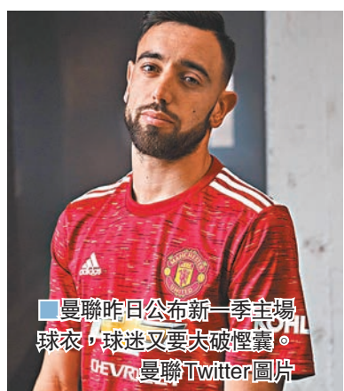
曼聯昨日公布新一季主場球衣，球迷又要突破怪囊。

曼聯於英超復賽後勢如破竹搶下季歐聯席位，不過這支英格蘭傳統勁旅當然不會因此滿足，繼續積極增兵為下季挑戰英超及歐聯錦標作準備。據多家英國傳媒報道，曼聯收購多蒙特翼鋒查頓辛祖的談判已接近完成，這位現年20歲的英格蘭代表隊成員將以1.2億歐元(約10.9億港元)的天價成為「紅魔鬼」一員，只待個人條款談妥後雙方將簽訂一紙為期5年的合約。