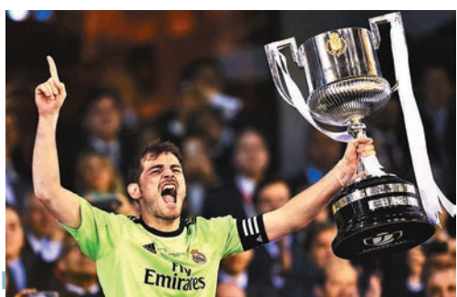
卡斯拿斯替皇馬贏得多項錦標。

香港文匯報訊(記者楊浩然)曾效力皇家馬德里及波圖等球會的前西班牙國家隊門將卡斯拿斯，於香港時間昨晚宣布以39歲之齡退役。