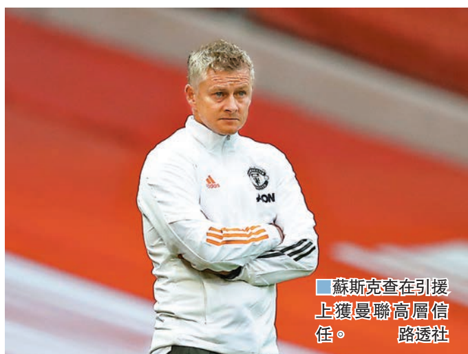
蘇斯查克在引援上獲曼聯高層信任。