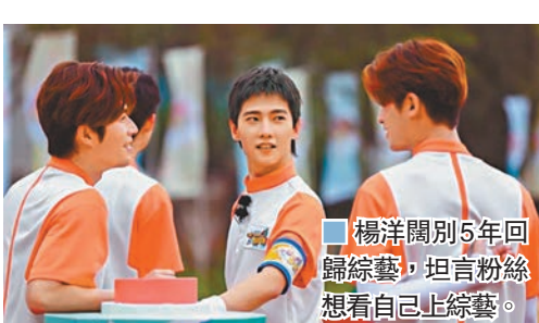
▲楊洋闊別5年回歸綜藝，坦言粉絲想看自己上綜藝。

很會玩GAG，還能把自己的成名曲《365個祝福》玩到經常爆GAG，心態特別年輕。陳學冬還透露，雖然自己參加的是遊戲競技節目，但也會有一顆唱跳的心，還會和蔡國慶一起大唱RAP。久未露面的吳奇隆此次參加綜藝令外界好奇，是不是來賺奶粉錢？吳奇隆未正面回覆，但他表示，很少參加綜藝節目，但自己一直有健身跑步的習慣，雖然節目的遊戲強度大但體力上卻還有一點點優勢。在節目中也學到了不少內地經典的童年遊戲，吳奇隆透露會回去和自家小朋友什麼遊戲都玩一玩。