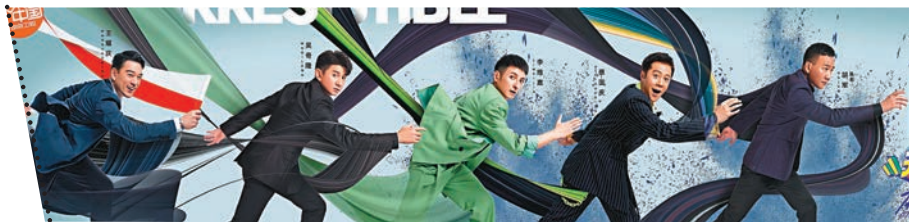
▲《元氣滿滿的哥哥》大哥隊，胡軍任隊長。