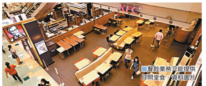
餐飲業務只能提供日間堂食。資料圖片

此外，公共場所的群組聚集最多兩人；室內外都必須一直佩戴口罩，違者定額罰款2,000元。