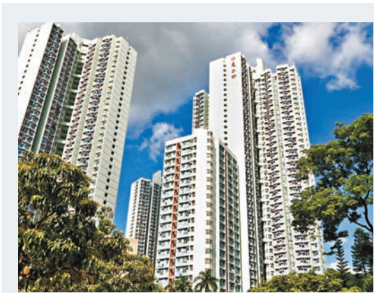
個案3426在慈雲山慈正邨家中等候入院。資料圖片

運輸署去信九巴指，如使用巴士總站部分地方作其他用途，需要得到有關部門批准。該署解釋，巴士總站屬於政府土地，如營運商想使用巴士總站部分地方作其他用途，需得到有關部門批准，但同意及感謝九巴相關做法。