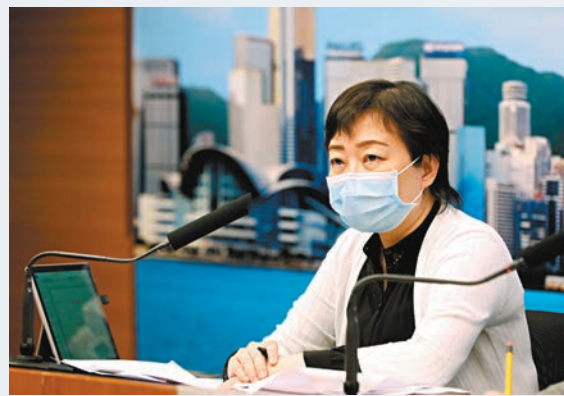
張竹君就事件致歉，並會跟醫管局協調更謹慎處理病人送院流程。