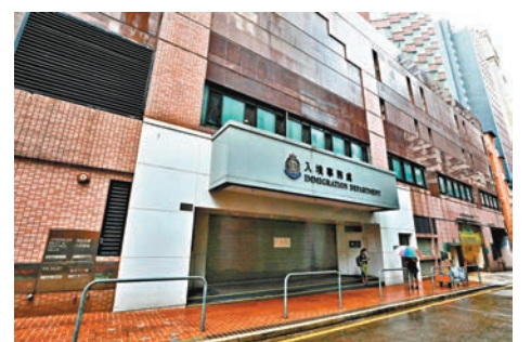
入境事務處西九龍辦事處有確診，需要馬上關閉消毒。

而因應九龍城裁判法院先後有兩名保安員確診，昨日起所有該法院的新羈押案件，轉往西九龍裁判法院直至另行通知。