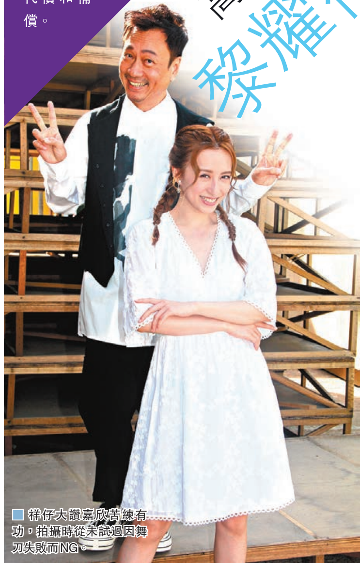
祥仔力讚嘉欣等練有功，拍攝時從未試過因舞刀失敗而NG。