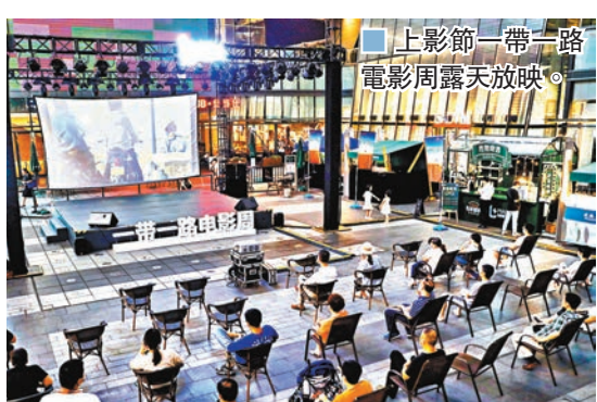
上影節一帶一路電影周露天放映。

香港文匯報訊（記者 倪夢環 上海報導）第23屆上海國際電影節正式落下帷幕，這場未置紅毯、不設評獎的電影節發出了行業新信號，內地影業亦邁出新步伐。據官方統計數據，上影節期間，29家官方影院共放映1,146場電影，觀眾達到147,502人次；通過線上線下聯動等方式，內地導演賈樟柯、美國編劇、製片人古士舒哈密士，法國編劇、導演奧利維耶·阿薩亞斯，日本導演河瀨直美與是枝裕和等中外知名電影人齊聚，暢談電影發展。而從7月17日宣布舉辦至8月1日，關鍵詞「上海電影節」和「上海國際電影節」的微博話題增量超3億；電影節視頻的微博播放量超千萬次……同時，由於新冠疫情影響，雖然今年上影節期間影院每場售票率為30%，每個影院每天放映不超過4場，展映影院數量減少，但展映中外電影仍然達到了322