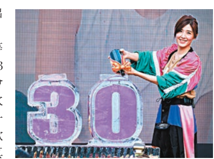
蘇慧倫今年出道30周年，並舉行見面簽名會慶祝。

舉辦大型售票演唱會，票房就開出紅盤。這次見面簽名會蘇慧倫和歌迷等待已久，距離上回簽名會已相隔13年，她笑說：「一直覺得辦簽名會已經是年輕一輩歌手的事了，這次要辦這個簽名會我自己也嚇了一跳！」這次特別在現場演唱新歌《安和》、經典歌曲《戀戀真言》，經典歌曲一唱瞬間催淚台下男歌迷。