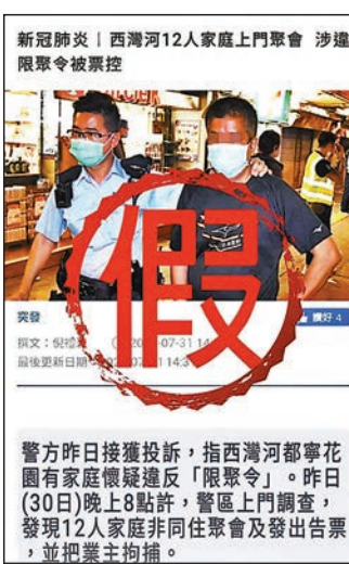
警方譴責造謠者誣職警員上門票控家庭聚會。

假新聞，「報道」以「西灣河12人家庭上門聚會，涉嫌限聚令被票控」為題，圖文並茂「報道」有「西灣河都寧花園」一家庭聚會被警方登門票控。警方昨日於facebook闢謠，指出該新聞機構從無報道上述「新聞」，有關圖片其實源自今年5月另一宗與限聚令無關的案件。警方譴責事件，呼籲市民不要誤信假新聞，又提醒市民小心辨別訊息來源，細看連結網址是否真正新聞網站，而轉發訊息前應先瀏覽不同新聞來源以確認其真確性。