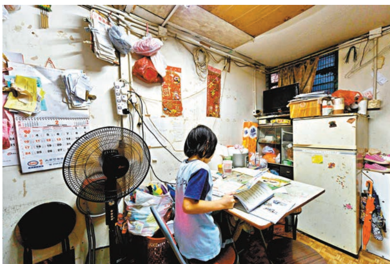
非公屋非綜援低收入二人家庭，一次過可獲九千元津貼。資料圖片

關愛基金秘書處指出，「N無津貼」的受惠住戶須以月租(或更長租期)形式租住私樓、工廈、商廈、非政府機構營辦的社會房屋、民政事務總署轄下「單身人士宿舍計劃」宿位、非政府機構提供予更生人士的宿舍，或居於臨時房屋、船艙或是無家者。