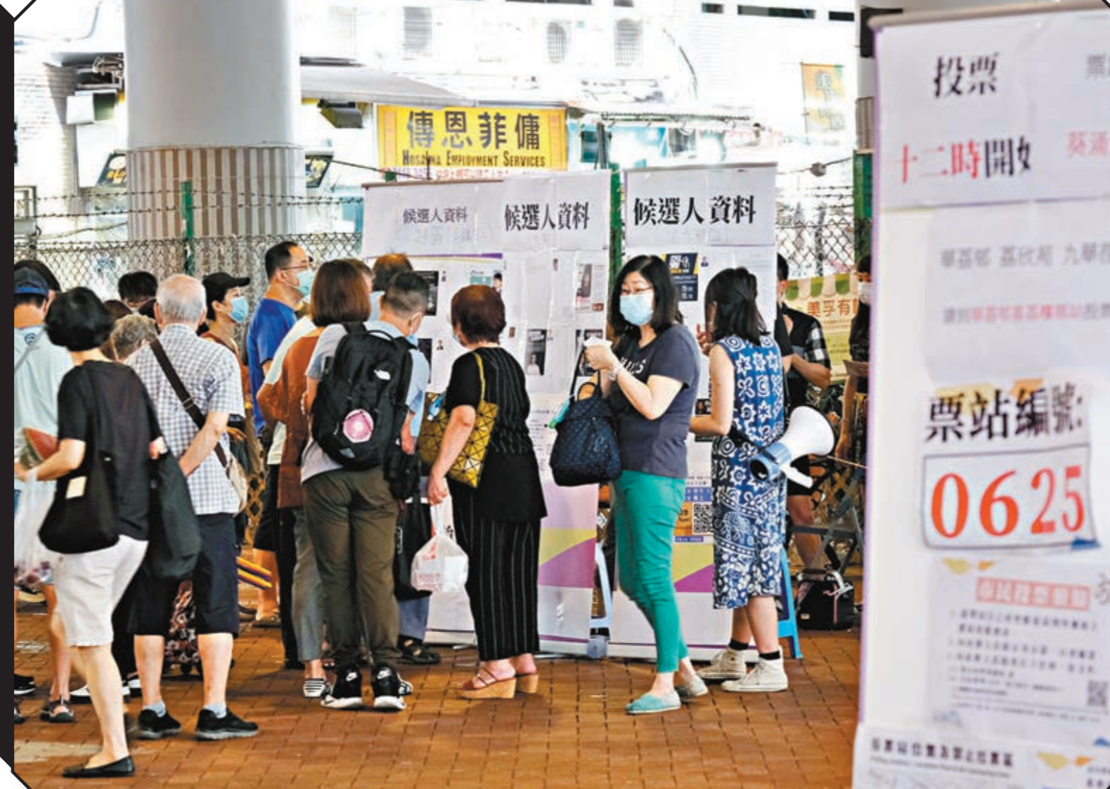
■所謂「初選」煽動市民聚集，疑為疫情爆發元兇。

此外，有三人確診的屯門眼科中心亦被發現與「初選」票站僅一街之隔。另數十間「黃店」曾借出地方作票站又同時營業，之後都證實有確診者曾經到訪。