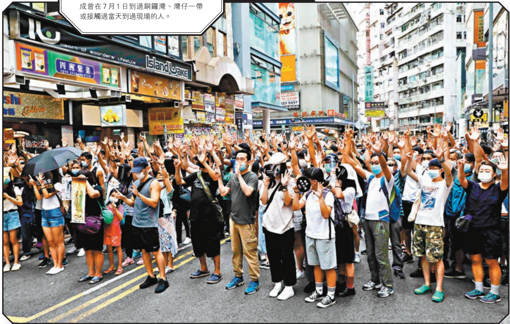
■攬炒派「七一」遊行反對國家安全法。圖為銅鑼灣現場。資料圖片

攬炒派在港島區發起非法遊行，當日有數千人聚集在銅鑼灣一帶，在場者不單沒有保持社交距離，部分人更不斷除下口罩，現場口水橫飛，極易造成交叉感染。據《大公報》報道，警方早前透過「超級電腦」追查確診者行蹤，發現近期數百宗確診個案中，就有近三成曾在7月1日到過銅鑼灣、灣仔一帶或接觸過當天到過現場的人。