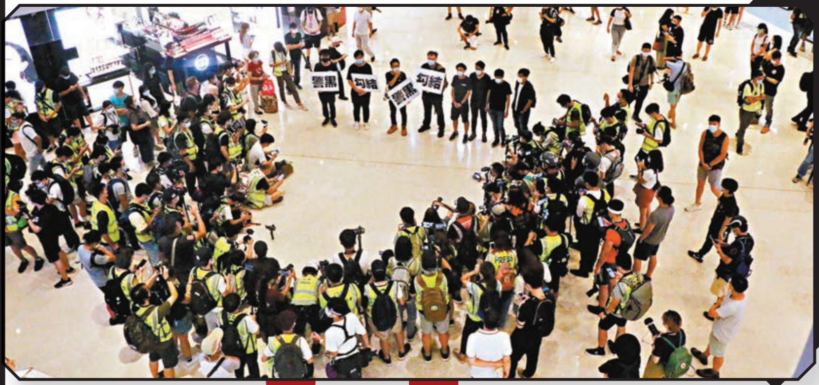
■攬炒派違反限聚令，罔顧社交距離「播毒」。資料圖片