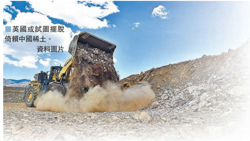
英國或試圖擺脫倚賴中國稀土。資料圖片

英國傳媒報道，由英國、美國、加拿大、澳洲及新西蘭5國組成的情報共享組織「五眼聯盟」，有意邀請日本加入，並將合作性質由情報共享，拓展為戰略經濟合作夥伴，如共享稀土等重要礦物等，以減少西方國家倚賴中國，並與中國抗衡。