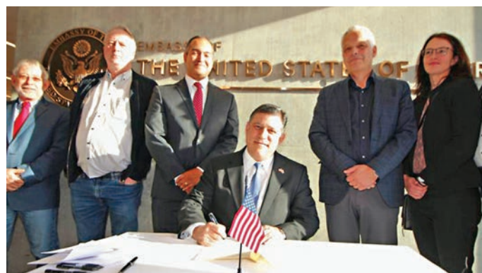
岡特(中)曾換走多名副大使。網上圖片