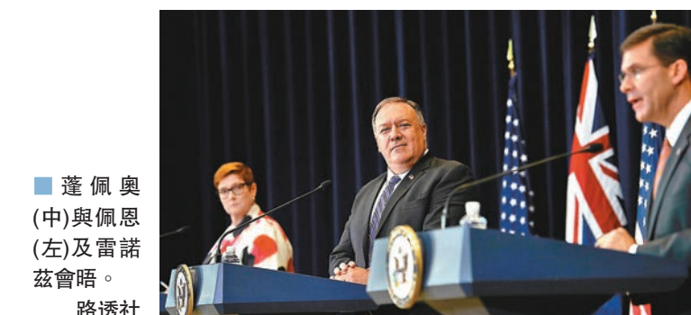
蓬佩奧(中)與佩恩(左)及雷諾茲會晤。

中國是澳洲的最大貿易夥伴，但雙方關係近期愈趨緊張，前澳洲駐華貿易專員克利夫頓批評，澳洲社會目前出現「有毒氛圍」，一旦企業贊同與中國進行經濟合作，便會被標籤為替中國辯護或緩靖主義等，認為商界必須閉腔回應日漸惡化的中澳關係。