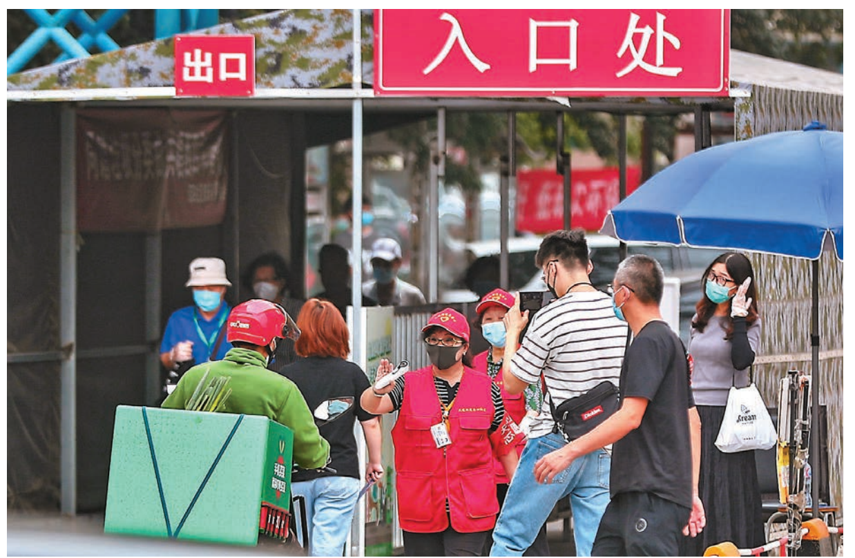
7月29日，北京市昌平區天通苑西三區入口，社區卡口工作人員勸阻外賣小哥進入。

大連方面，其疫情已經擴散至遼寧、吉林、黑龍江、福建、北京五個地方，大連衛健委相關負責人介紹，大連正以密切接觸者為重點畫大「包圍圈」，科學做好流調溯源工作。同時，大連已要求停止所有餐飲服務經營單位的聚集性就餐活動。