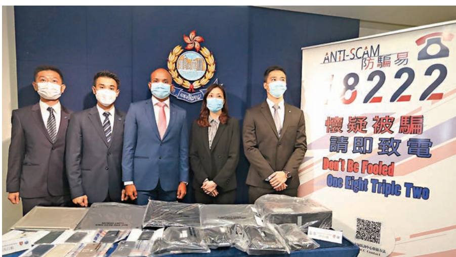
警方商業罪案調查科交代案情，提醒市民小心保護信用卡個人資料。