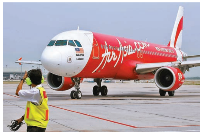
市民購買亞洲航空機票，航班取消未獲退款。資料圖片

香港文匯報訊 有區議員接獲18名亞洲航空的顧客求助，指公司因疫情取消航班，但一直無法獲得機票退款，涉及1,000元至16,000元不等，有苦主表示，至今未能與職員真人對話，只能透過電郵溝通。