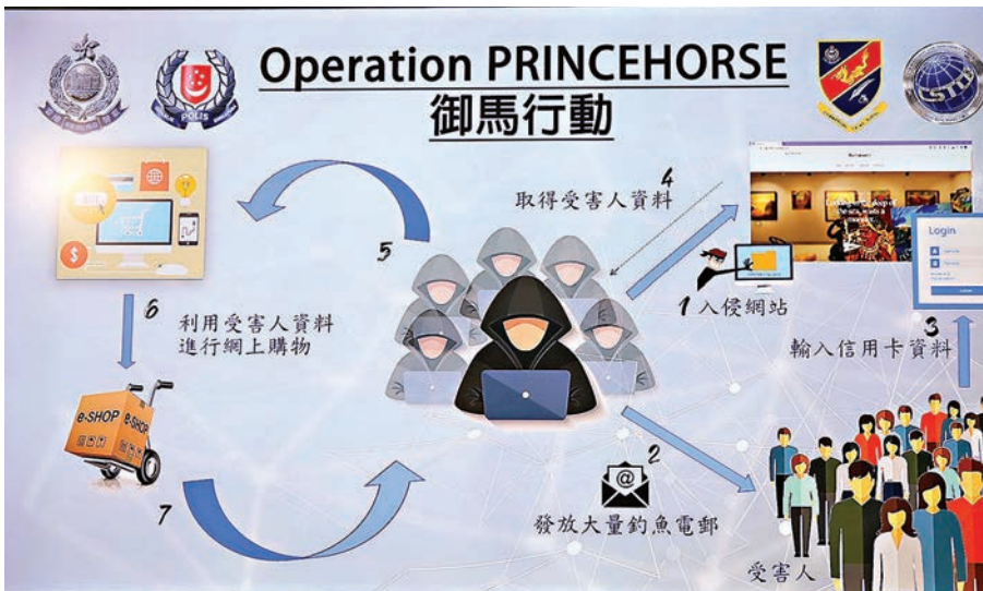
跨國釣魚電郵詐騙集團行騙流程图。

警方表示，今次是香港警方首次偵破使用釣魚電郵詐騙的國際犯罪集團，在本地被捕的五人為骨幹成員，在香港運作約一年，警方相信該犯罪集團已被瓦解。