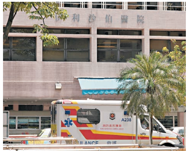
▲昨日，香港的新冠肺炎死亡個案增加至22宗，其中有兩名患者在伊利沙伯醫院留醫後不治。