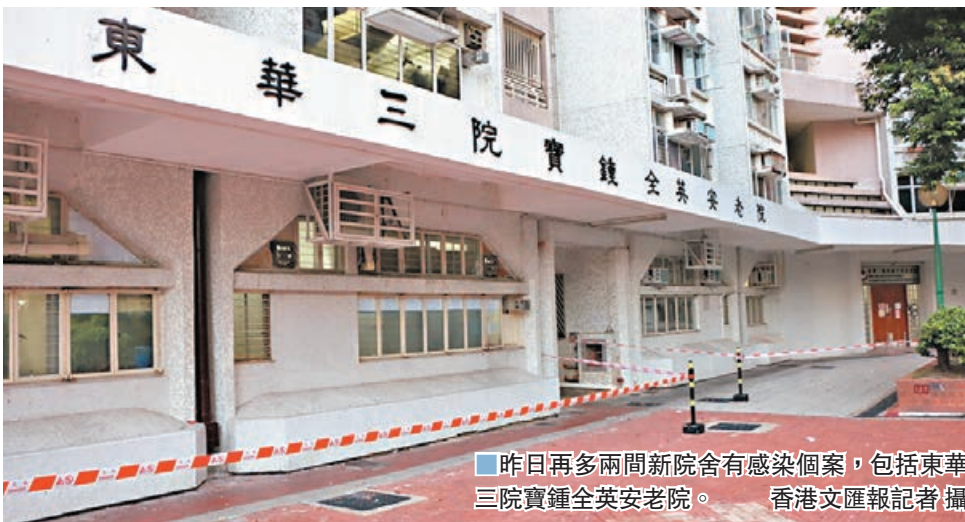
▲昨日再多兩間新院舍有感染個案，包括東華三院寶鐘全英安老院。

對於院舍爆發情況持續，張竹君指院舍的員工和探訪者來自社區，部分長者亦有可能外出活動，院舍無法與社區完全隔離，加上所有人都未對新冠病毒有抗體，而長者免疫力亦較差，認為在出現社區爆發的情況下院舍難免出現個案，現時首要工作是控制疫情在社區蔓延，以防止院舍疫情惡化。